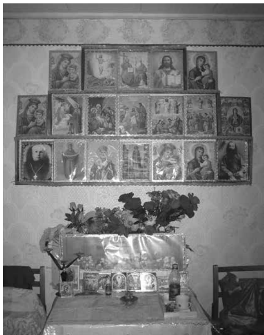
1. sz. ábra Rituális tér egy inochentista otthonban, Tomaj, Moldova