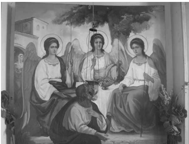
6. sz. ábra A Szentháromság képe (Rubljov nyomán), mely Ábrahámot és Sárát ábrázolja, a missziós templomból, Kjubisev, Ukrajna.