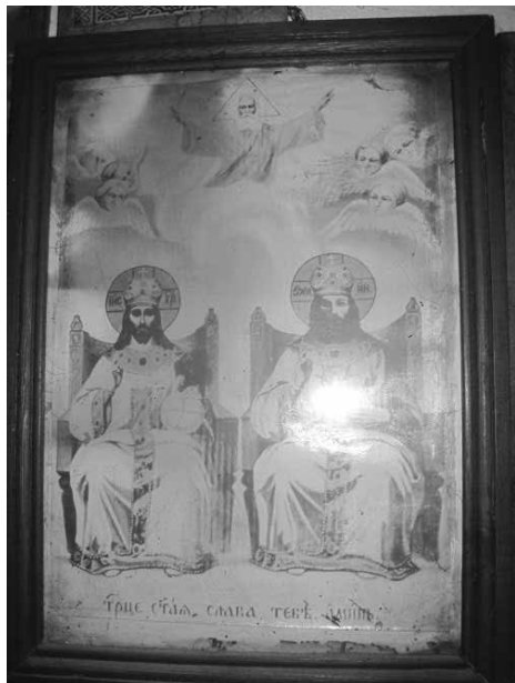
5. sz. ábra Inochentie ábrázolása meny- nyei trónusán, mint a Szentháromság harmadik személye, Kjubisev, Ukrajna