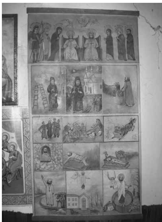
2. sz. ábra Narratív tér egy inochentista otthonban, Lipectoje, Ukrajna