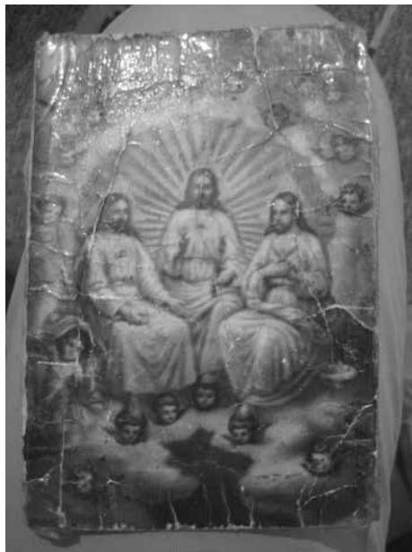
7. sz. ábra Fridolin Leiber képének másolata, a fénykép egy tomaji (Mol- dova) inochentista otthonában készült