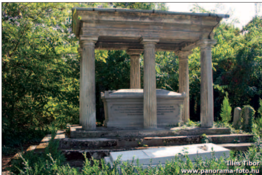
Löv Lipót síremléke a szegedi zsidó temetőben