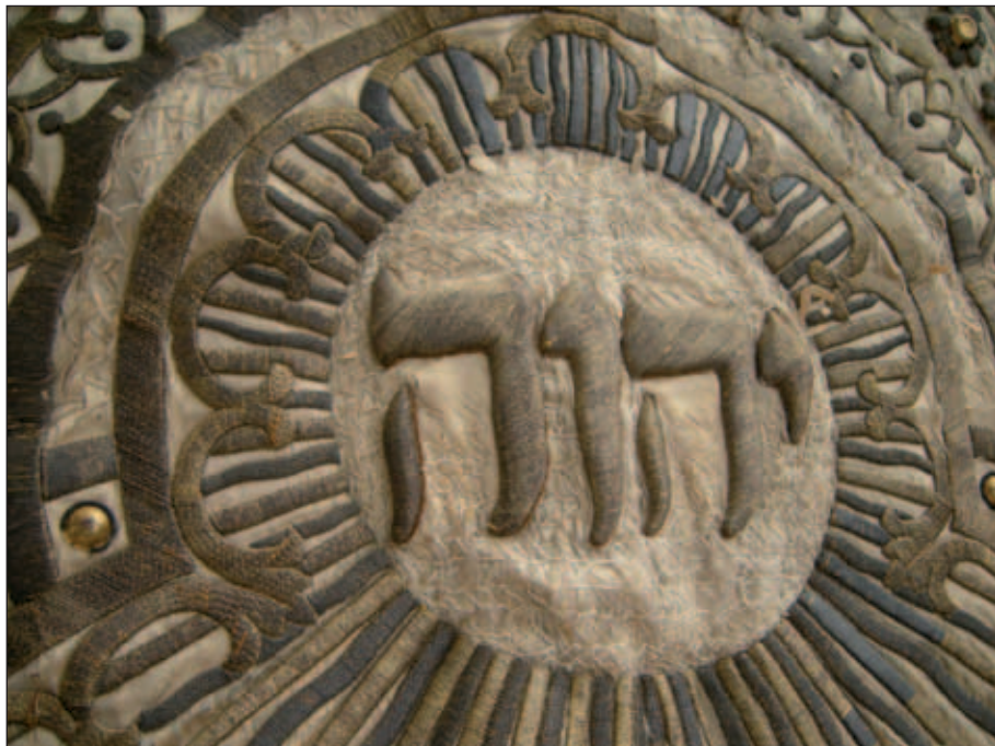
Istennév egy Tóraszékény-függönyön