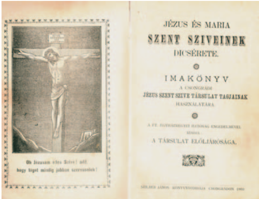
8. A csongrádi Jézus Szíve Társulat részére összeállított imakönyv előlapja