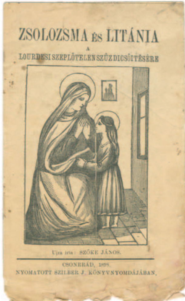
17. Szóke János csongrádi harangzó által kiadott imádságos ponyva előlapja