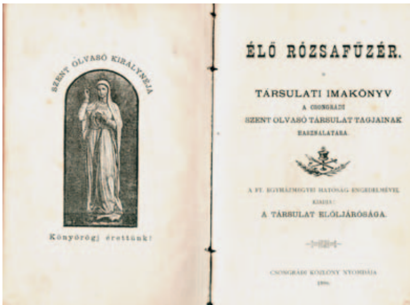
9. A csongrádi Élő Rózsafüzér Társulat számára összeállított imakönyv előlapja