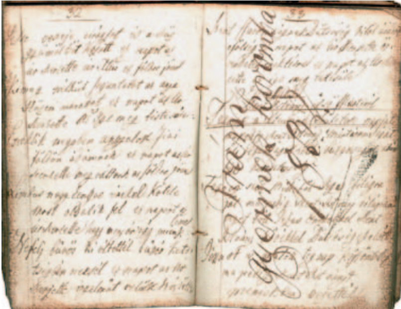
12. Részlet Sohlya Antal gyermekkori imakönyvéből