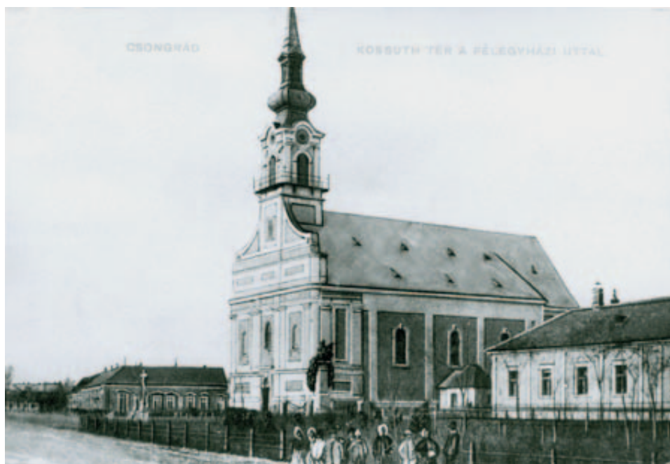
1. Kossuth tér a félegyházi úttal, 1905 előtt