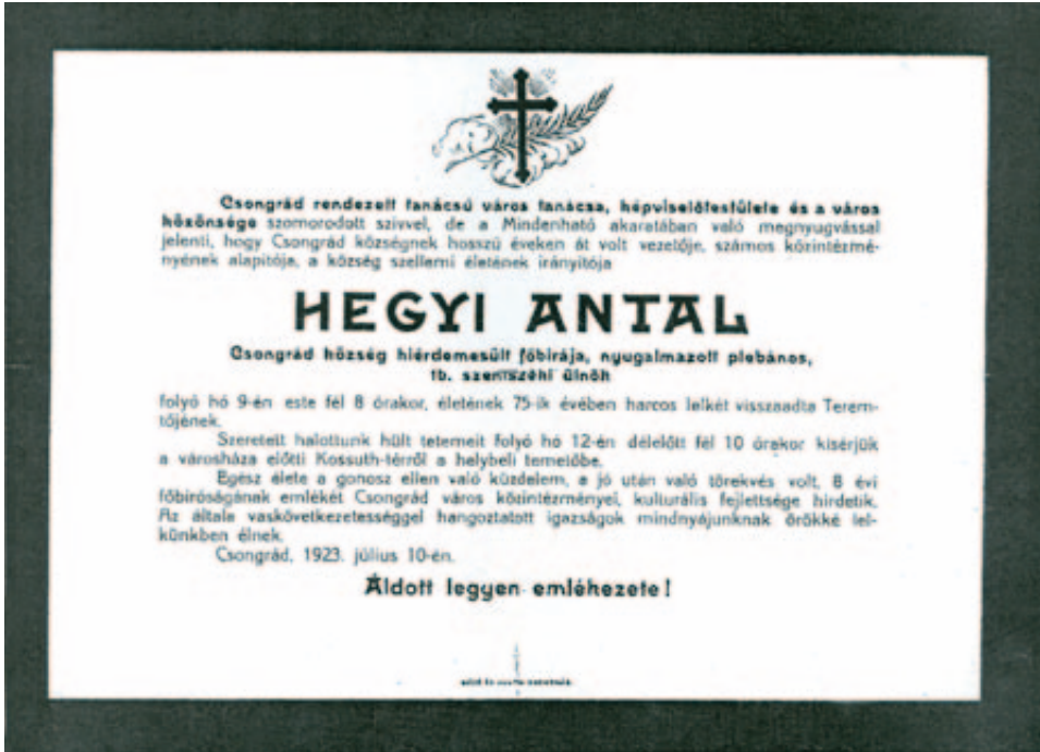
21. Hegyi Antal gyászjelentése