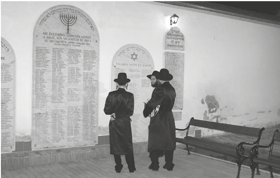
Makói zarándokok az első világháborús emléktáblák előtt