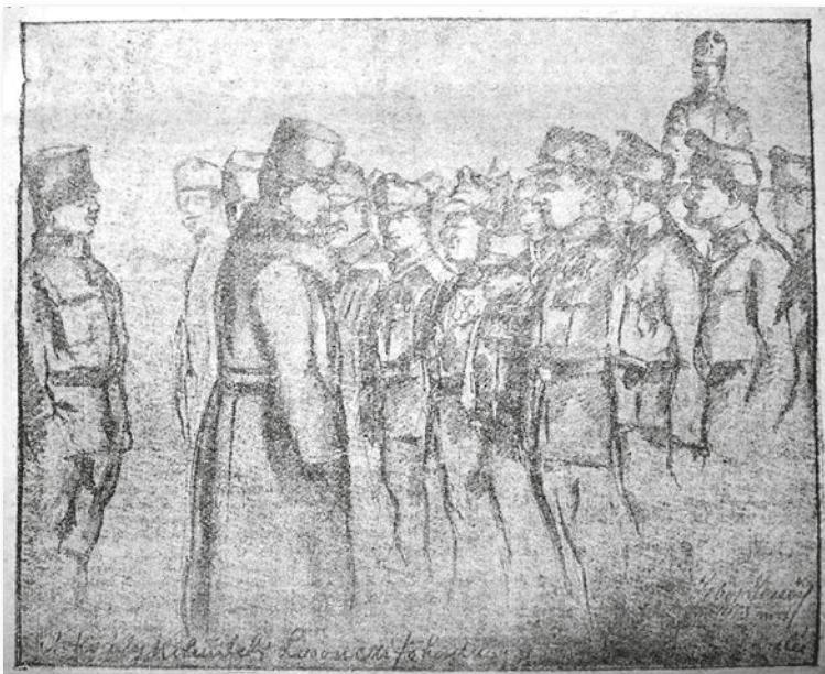
IV. Károly izraelita katonák körében