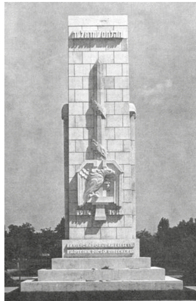
Isten kardja izraelita emlékművön