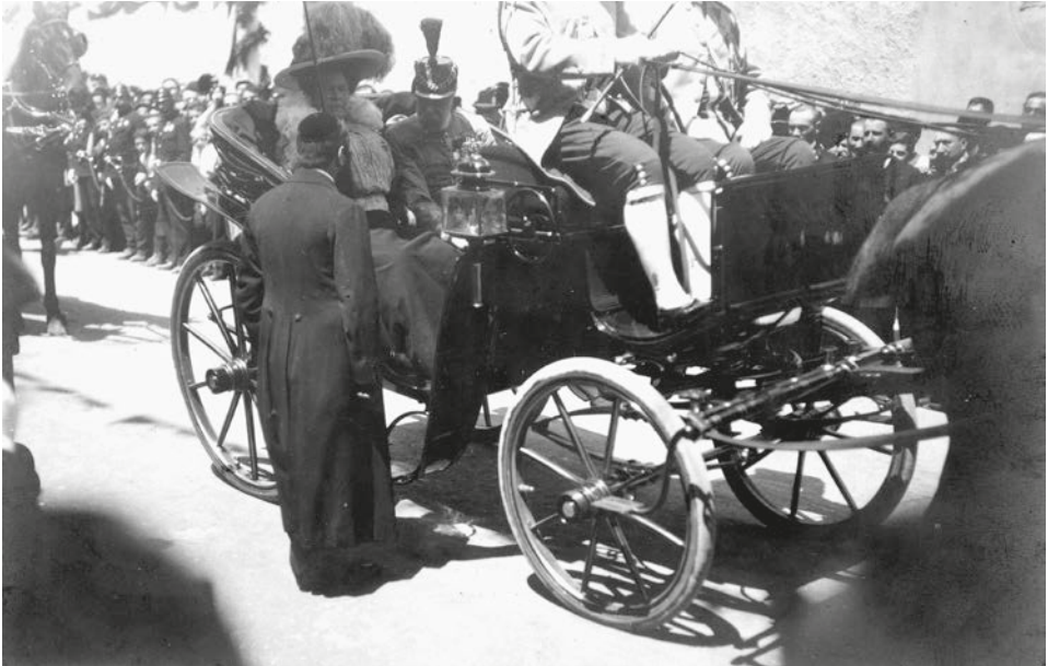
A pozsonyi orthodox főrabbi áldást mond a királyra (1909)