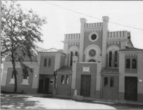
בית מדרשו של רבינו זצ"ל במאקאווא