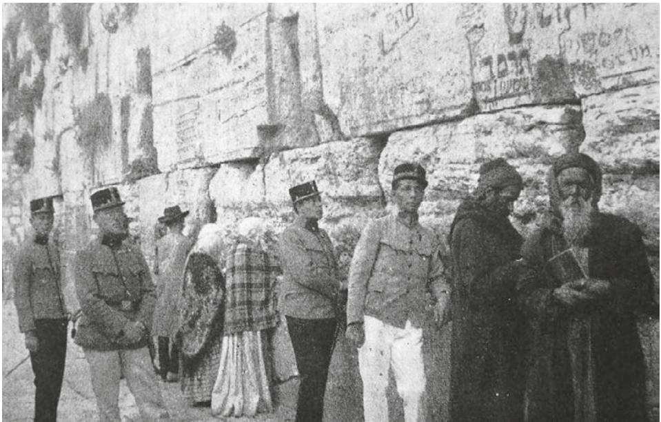
Magyar zsidó katonák a Siratófalnál