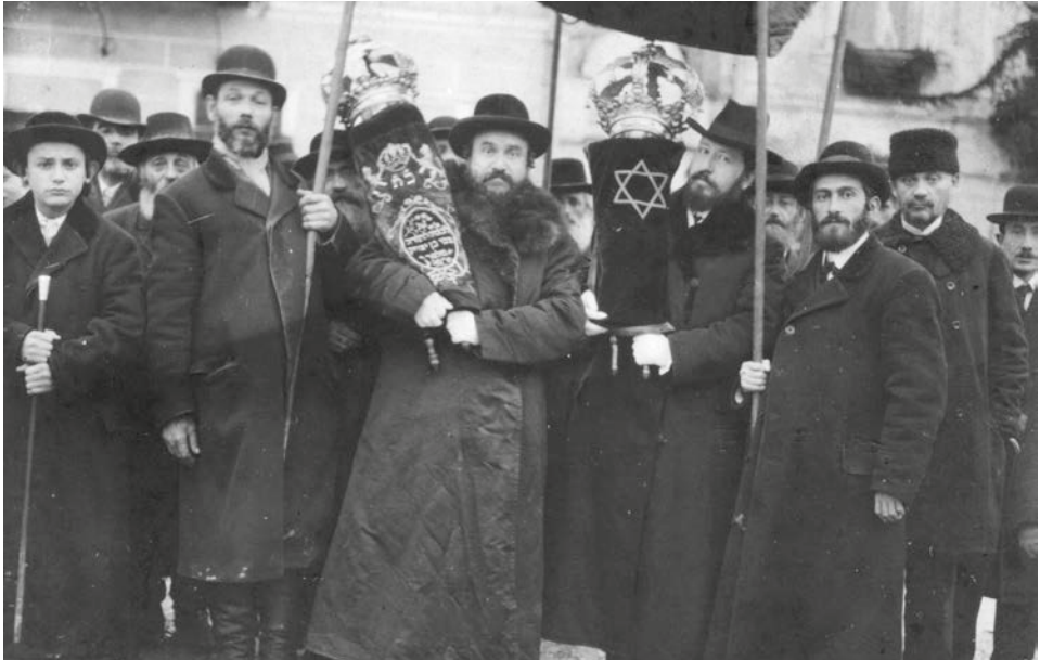
Frigyes főherceg fogadása Podhajceben (1915)