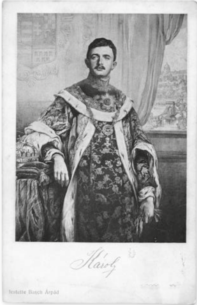
Basch Árpád: IV. Károly