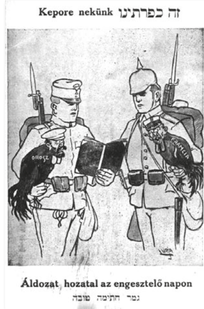
Káppará az ellenségre