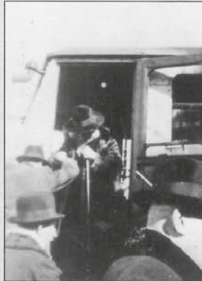
רבינו ז"ל יורד מהרכבת בחזרו מבודפשט בימי זקנותו