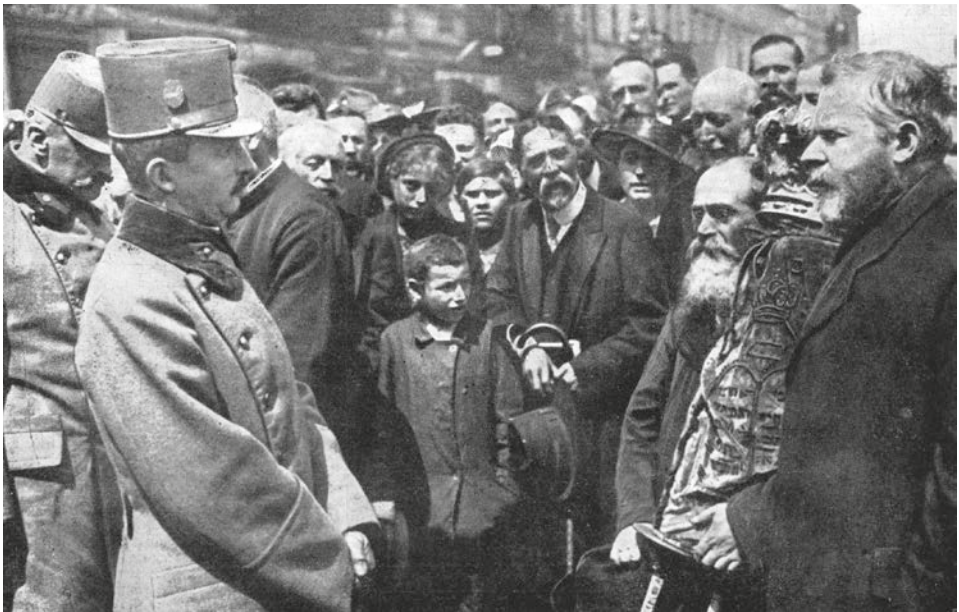
IV. Károly király kolomeai zsidókkal (1917)