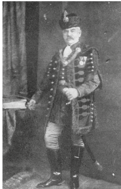
Neológ előljáró díszmagyarban