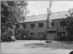
ביתו של רבינו זצ"ל במאקאווא