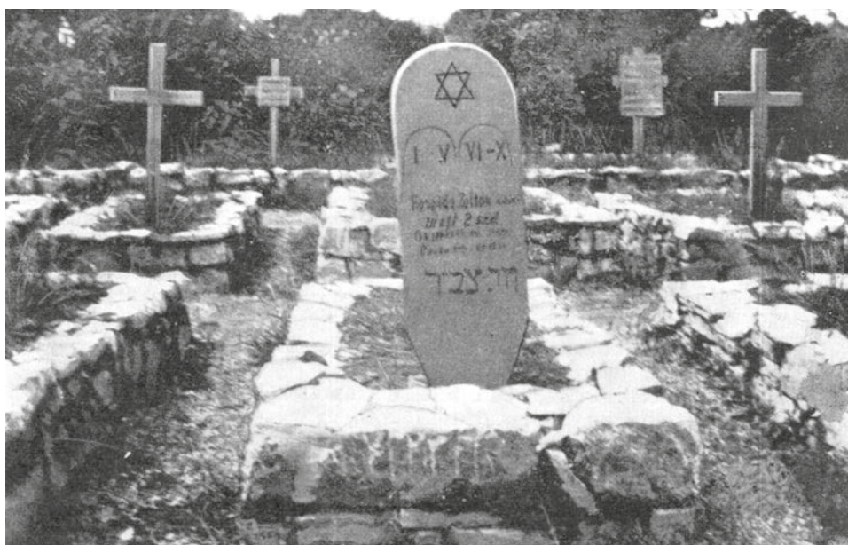
Doberdói katonai temető