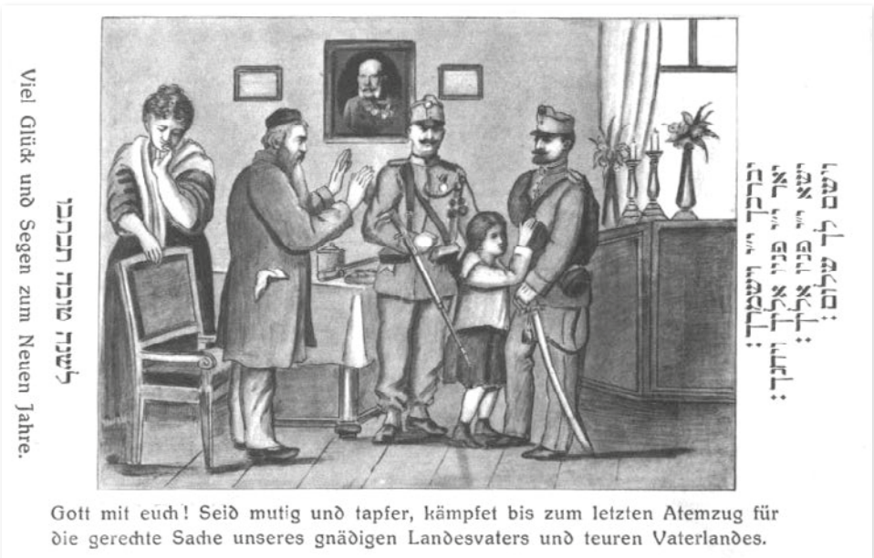
Első világháborús propaganda képeslap