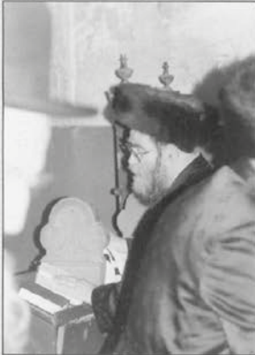
נאב"ד מאקאווא בחפילה ברויטר'ד העקיע במקום בו התמללו אבותיו