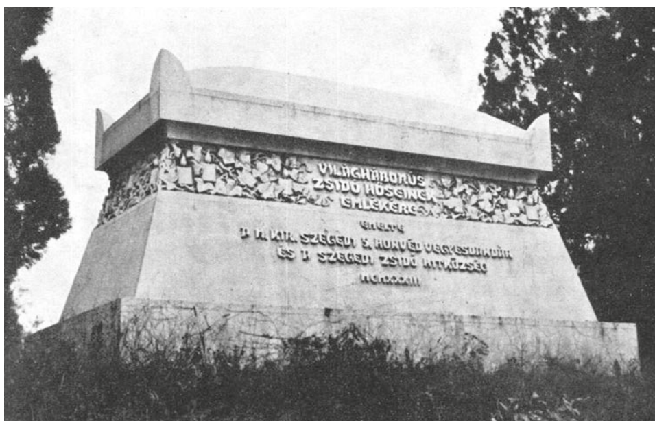
Szegedi izraelita hősi emlékmű