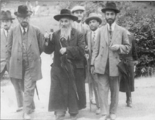
רבינו זצ"ל עם כמה מיהודי הייך