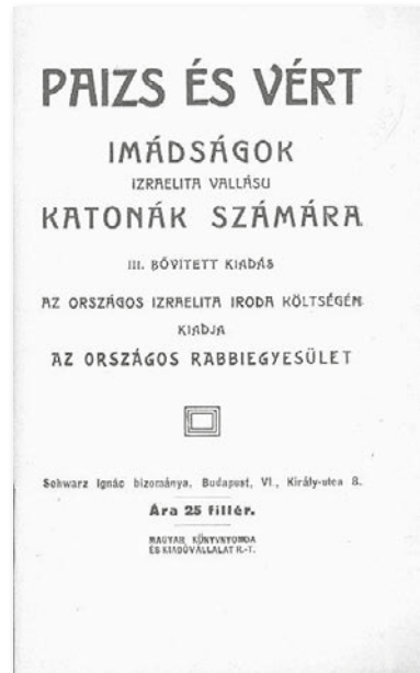
Izraelita katonai imakönyv