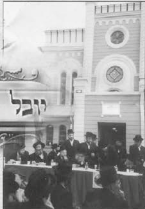
נאב"ד מאקאווא בחנוכת הבית לביהמ"ד במאקאווא