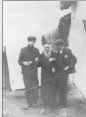
בנס באמאסאוא בעת תש"ד מלווה ב"ג שותלמדיי, שחיטני עם הטלא הערוב