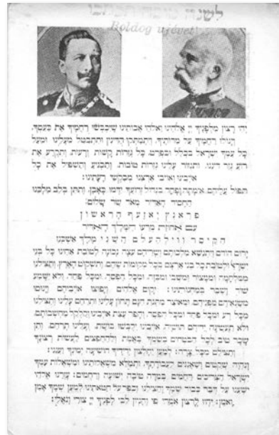
Ima az uralkodóért képeslapon