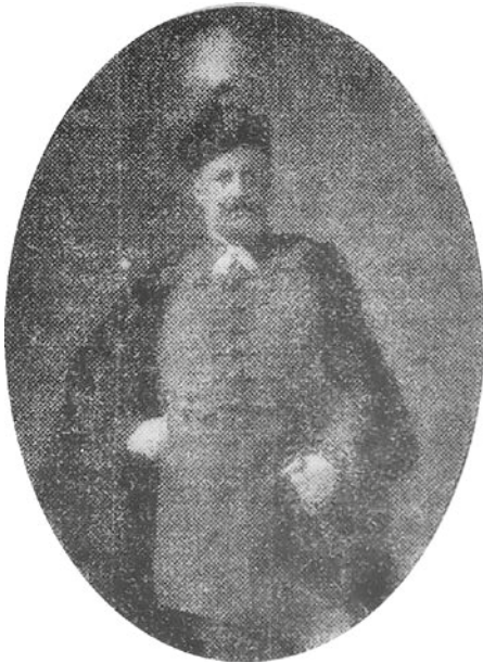
Orthodox előljáró díszmagyarban