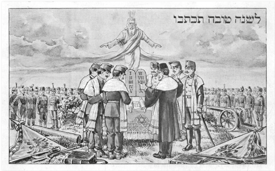
Tóraolvasás a K.u.K seregében