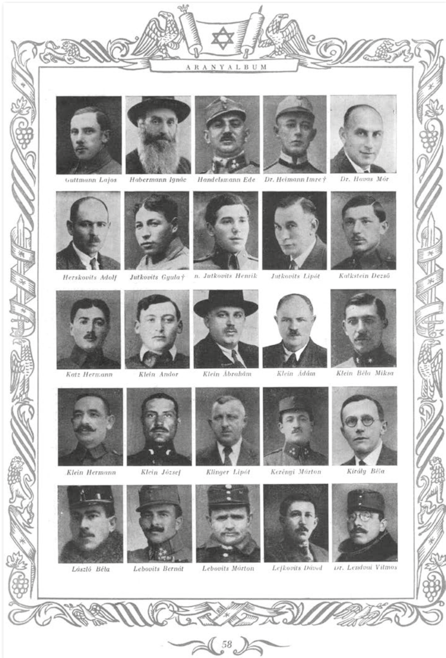
Izraelita hadviseltek az „Aranyalbumból”