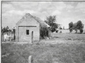
ה'אהל היטו' במאקאווא