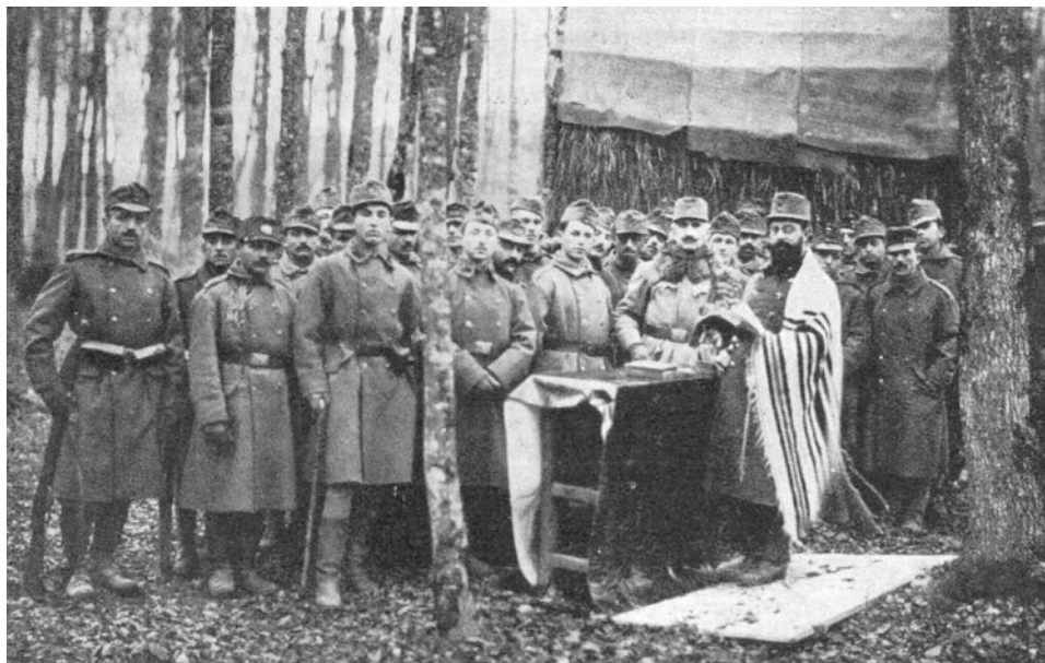
Istentisztelet a 44. gyalogezrednél az orosz fronton