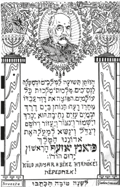
Hánótén tesuá ima képeslapon