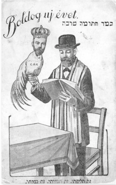
Káppará a cárra