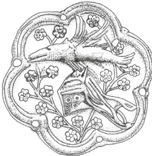
2. kép A Csertán nemzetség jelvényét, csukát ábrázoló lovagi sisakdísz a kelebiai kincs egyik ezüstlemezen (a szerző rajza)