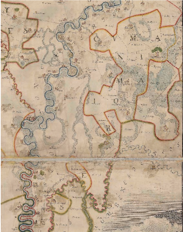
3. kép A Nagykunság a 18. század közepén. Mikoviny Sámuel: Mappa Partis Regni Hungariae qua Iazyges Cumani Maiores et Minores continentur. 1731 (részlet).