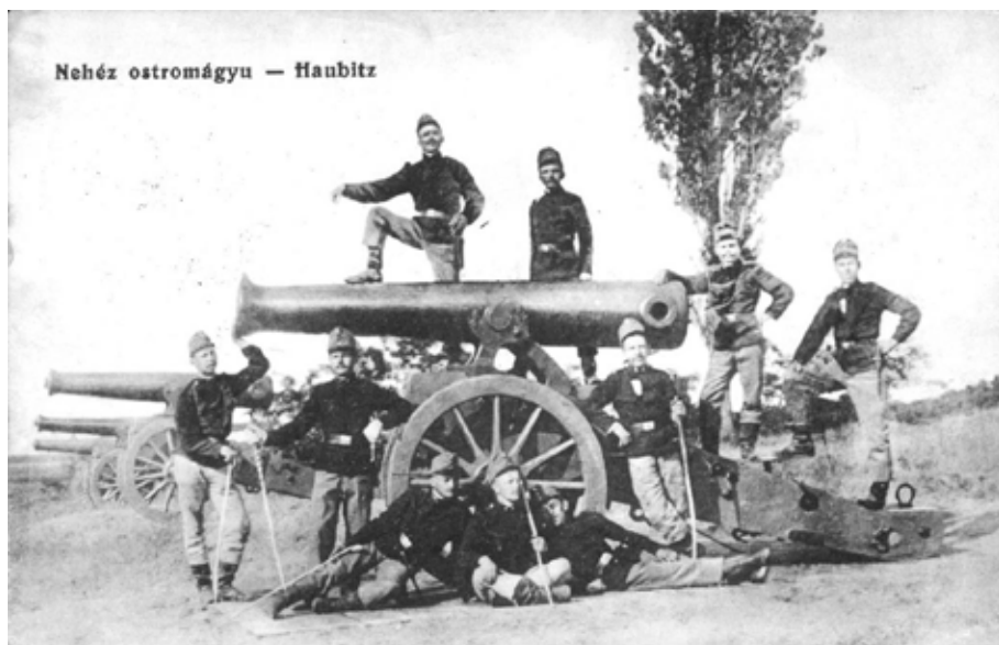
3. kép A tüzérség a központi hatalmak ereje