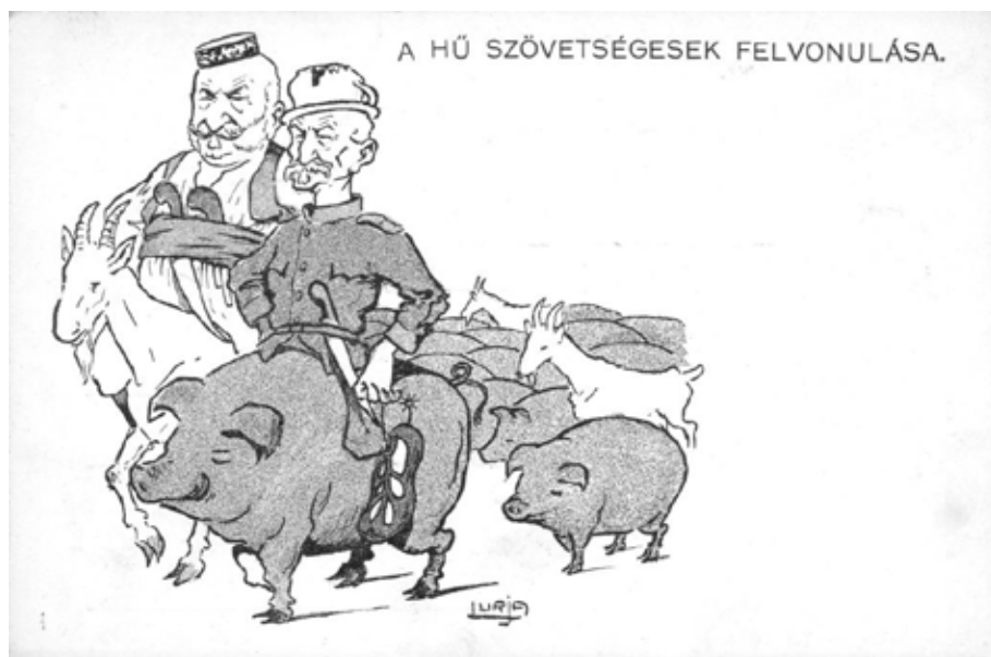
4. kép Gúnyrajz a szerb és montenegrói uralkodóról