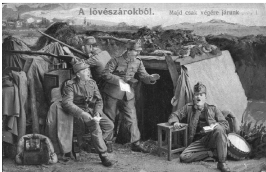
5. kép Jókedvű katonák a lövészárokból