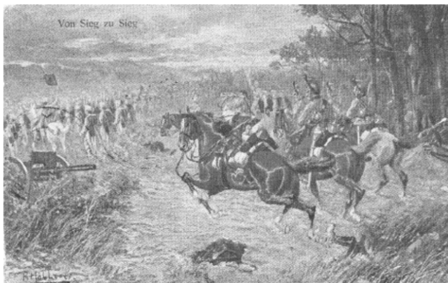
6. kép Háborús üdvözlőlap, 1916. II. 25.