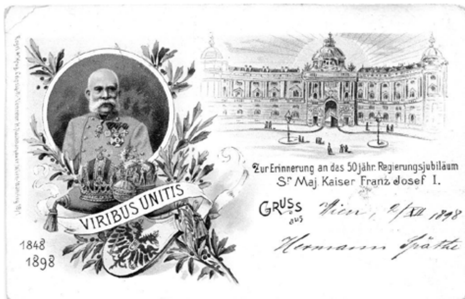
1. kép Jubileumi képeslap Ferenc József uralkodásának 50. évfordulójára