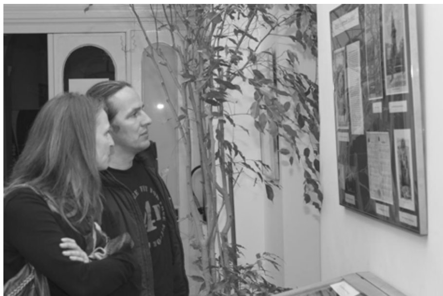
Időszaki kiállítás a Folyosó Galérián