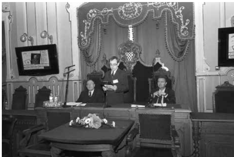
Megnyitó a városháza dísztermében