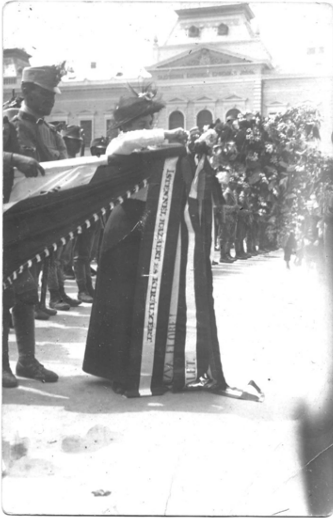
Frontra induló katonák (Óbecse)