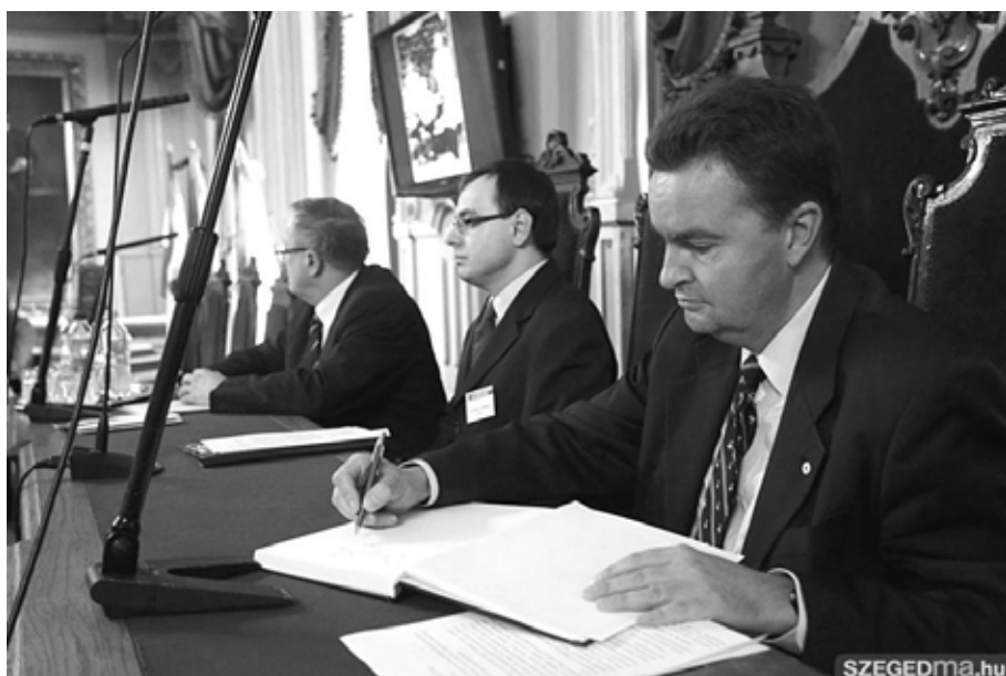
Bejegyzés a tanszéki emlékkönyvbe