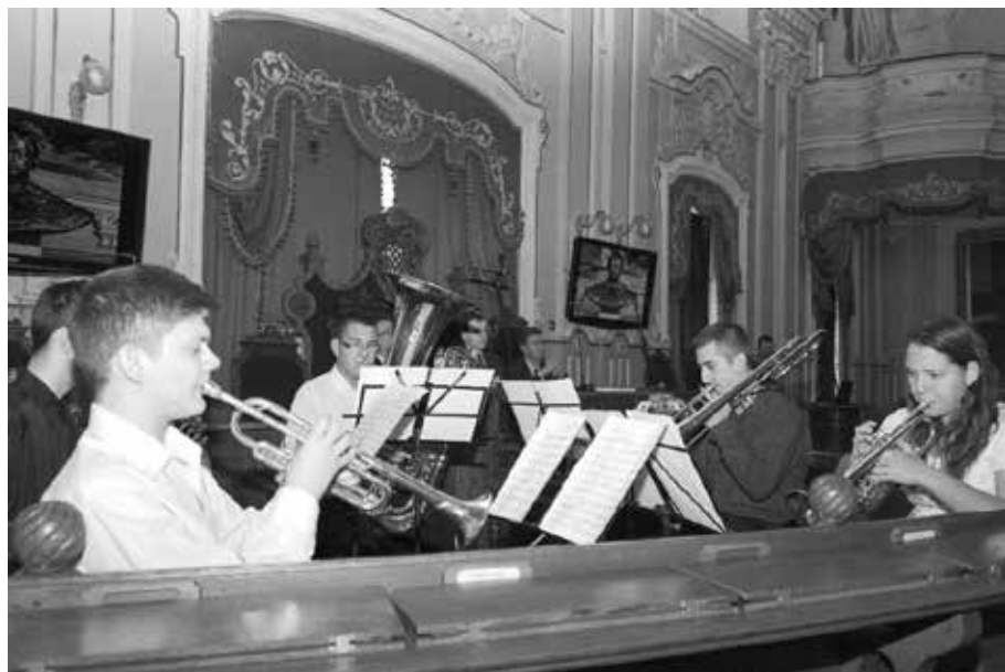
Strauss: Éljen a magyar