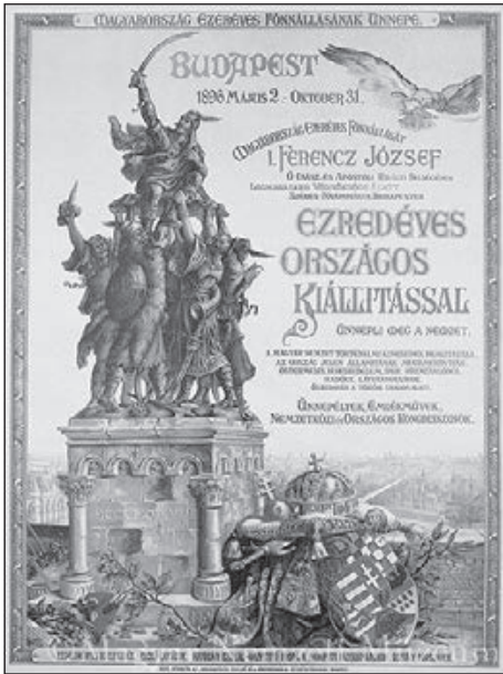
1. Az Ezredévi Kiállítás = nemzeti seregszemle. Ezredéves kiállítás épületei – Magyar Nemzeti Digitális Archívum.