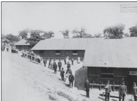
11. A látogatók szállása. Ezredéves kiállítás épületei – Magyar Nemzeti Digitális Archívum.