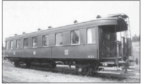
14. A legtöbb látogatót szállító III. osztályú MÁV személykocsi.