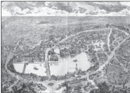
5. A látogatóknak adott kiállítási térkép. Ezredéves kiállítás épületei – Magyar Nemzeti Digitális Archívum.