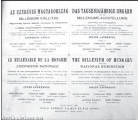
4. A szervezéshez szétküldött felhívás. Ezredéves kiállítás épületei – Magyar Nemzeti Digitális Archívum