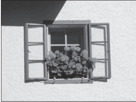
7. A „magyar” muskátli.