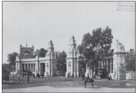
2. A Milleniumi kiállítás I. főkapuja az Andrássy út végénél. Fotó: Klösz György, 1896. Fortepan / Budapest Főváros Levéltára.