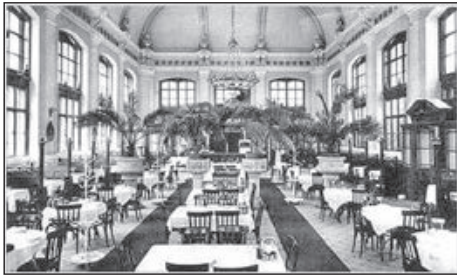
9. A Budapest Nyugati pályaudvar első osztályú restije. Ungarn, Erdélyi K.u.K. Hof-Kunstanstalt Budapest, 1909.