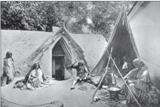
3. Az alcsúti szegkovács cigány család. Ezredéves kiállítás épületei