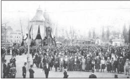
13. Látogatók a Főkapun belül.