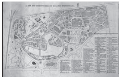
12. Ezredéves kiállítás épületei – Magyar Nemzeti Digitális Archívum.