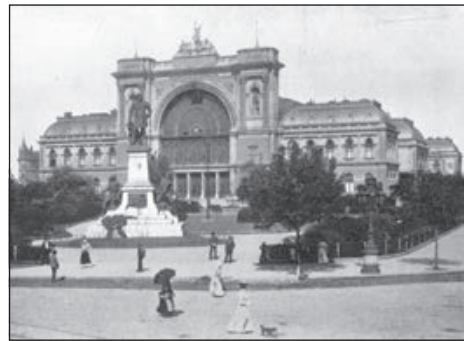
10. Budapest, Keleti pályaudvar (MÁV).