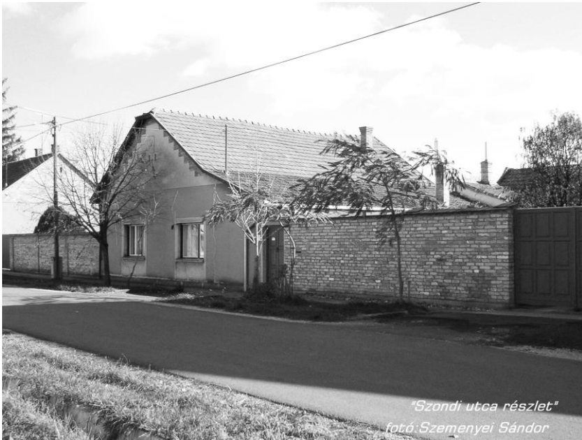
Szondi utcai ház.