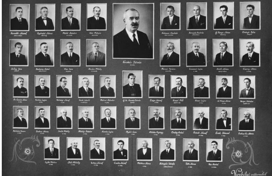
A Kecskéstelepi Polgári Kör tisztikara és választmánya 1939-ben.