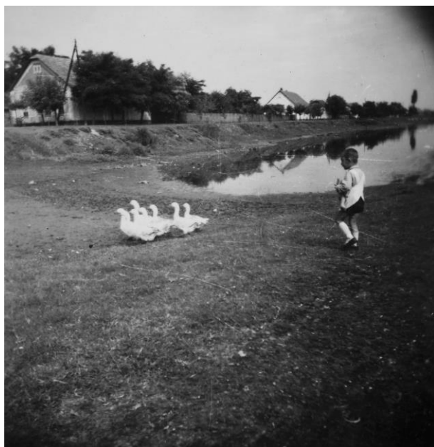
Libát terelő gyermek a vályogvető gödörnél, háttérben a Palánkai sor, kb. az 1940-es évek eleje