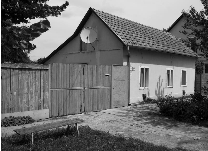
A Zombori utca utolsó háza volt, kis paddal az utcán.