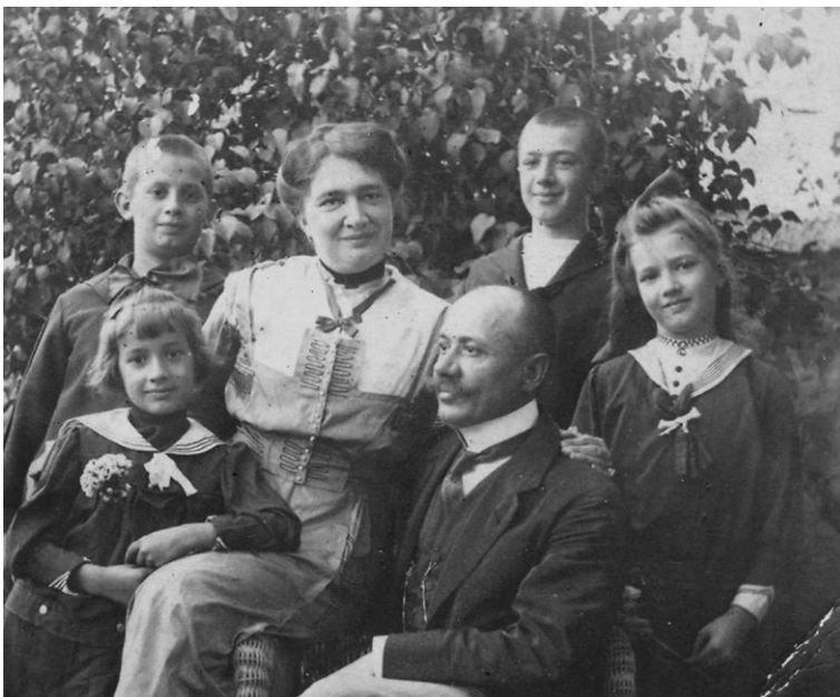
4. kép: A Pataky család Óbecsén 1917-ben