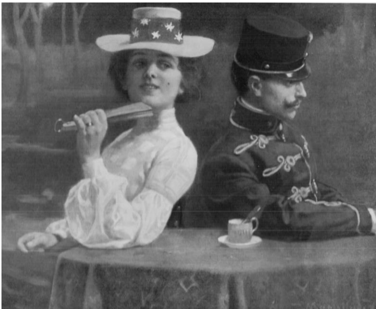
Magritay Tihamér: A duzzógó huszár (részlet, aquarell-nyomás, 46x67 cm, magántulajdon)