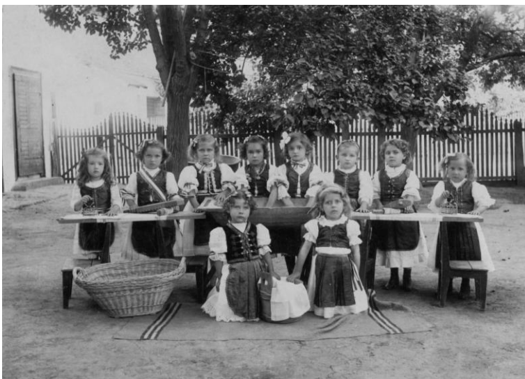
5. kép: Óvodai bemutató, Óbecse