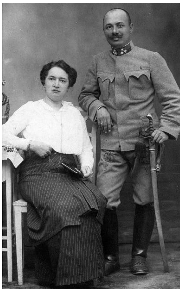
2. kép: A házaspár 1915. július 26-án