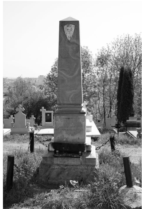
5. kép: Első világháborús emlékmű a Kalandos temetőben (1943. jún. 27.)