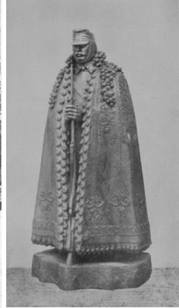
2–3. kép: A Kárpátok Őre avatása (1915. aug. 18.)