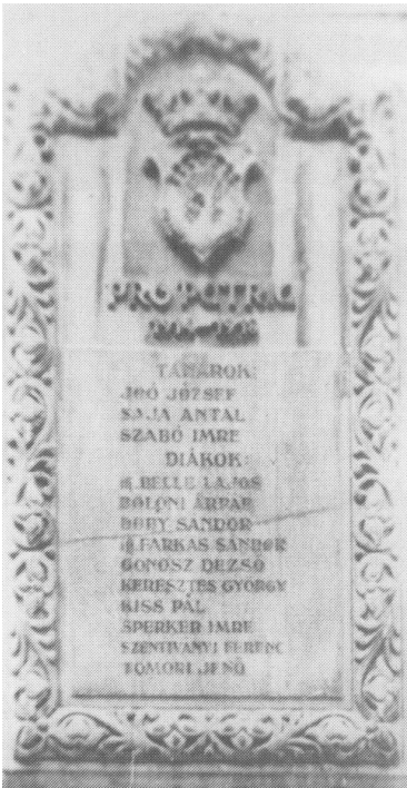
4. kép: A Református Kollégium első világháborús hőseinek emléktáblája (1940. okt. 31.)