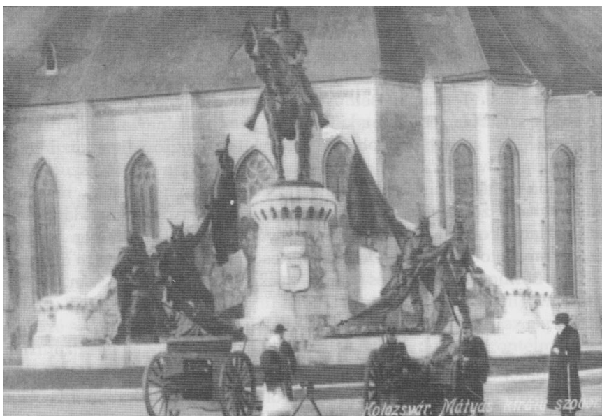
1. kép: A Mátya-szobor előtt közszemlére kitett hadizsákmány orosz és szerb ágyúk (1915. jan. 4.)

In my study I am interested in observing the appearance of the memory of WWI in the public sphere of Cluj during and after the war, the methods, tools, festive occasions and forms that were used to keep the interest alert, respectively to sustain the feeling of involvement of the civilian population. The world war that was started with the Austrian–Hungarian declaration (28 July 1914) constructed a new type of hero in publicity: the heroic dead. I consider that it is important to present the major functions of memorial actions and commemorations: the assigning of events outside/beyond locality to a certain space, the presentation of the (victorious) war, the editing of the biography of the hero sacrificing himself for his country, the stimulation of civilian will for sacrifice.