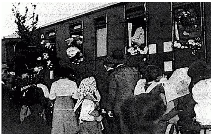
Sebesültszállító vonat fogadása. (Kramer Elza felvétele, 1914. Balaton. A Balatoni Szövetség Hivatalos Értesítője)

express their esteem towards the heroes in practice (thus participating in the war) they could connect, the hero cult could take its shape.