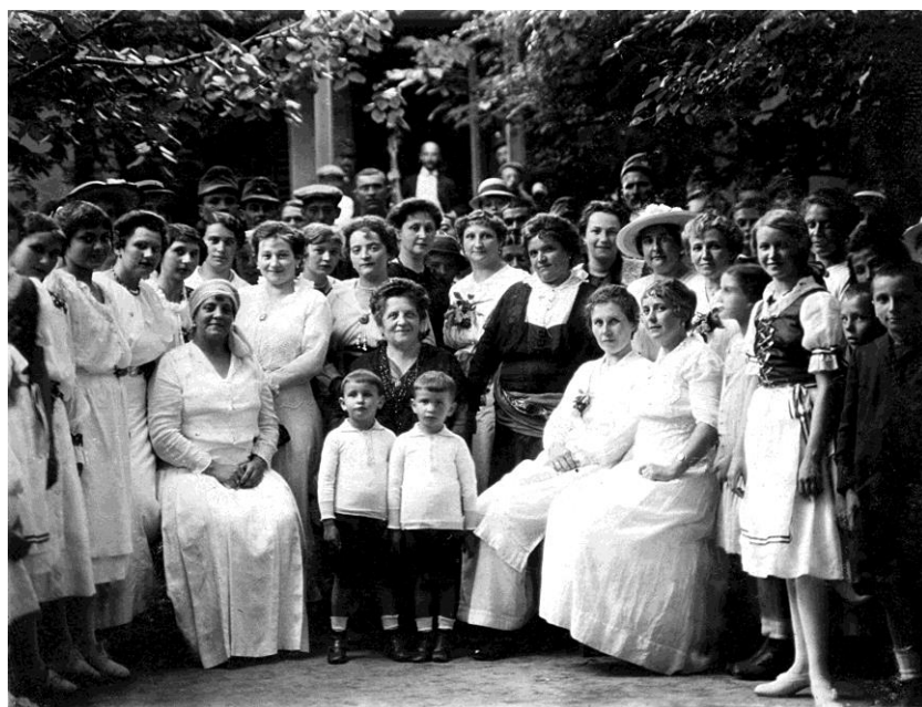
A balatonfüredi hölgyek és a megvendégelt katonák.