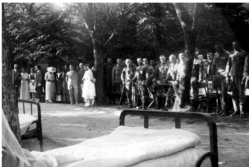
Lábadozó katonák a füredi Kiserdőben.