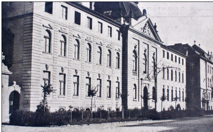
Az Állami Polgári Iskolai Tanárképző Főiskola épülete