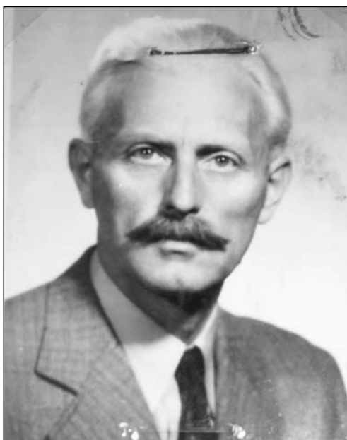
FOTÓ 6 „ A szabadulás 1. napján. 1956.10.09. Szem.ig.kép. ”