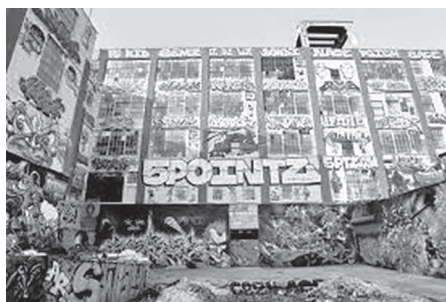
A 5Pointz belső udvara 104

A jogesetben hivatkozott törvény, a VARA azoknak a képzőművészeti alkotásoknak biztosít védelmet, amelyek úgynevezett „ recognized stature ”-rel 105 rendelkeznek. 106 Mindkét ítéletben 107 megállapításra került, hogy 45 falfestmény megfelel ennek a követelménynek, így azok védelemre jogosultak. 108 A bíróságok figyelembe vették a 5Pointz művészeti jelentőségét is, amely főként Meres One kurátori tevékenységének volt köszönhető. 109 Továbbá indoklásaikban kitértek arra is, hogy az épület az évek alatt New York egyik látványossága és egyfajta „szabadtéri kiállítása” lett, amelyet nem csak turisták és fiatalok kerestek fel szívesen, hanem rendszeresen feltűnt filmek és reklámok háttérében is. 110