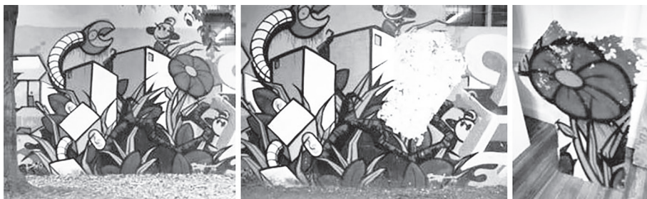
Martinat akciója előtt és után készült képek, valamint a kiemelt részlet a kiállító teremben 167

a „Vandalizmus a vandalizmus ellen” elnevezésű rendezvényén olyan kültéri alkotásokat állított ki és kínált fel eladásra a művészek engedélye nélkül, amelyek vagy nem voltak aláírva, vagy ugyan beazonosítható volt a művész személye, de az egész műből csak egy részletet emelt ki egy speciális technika segítségével. 166