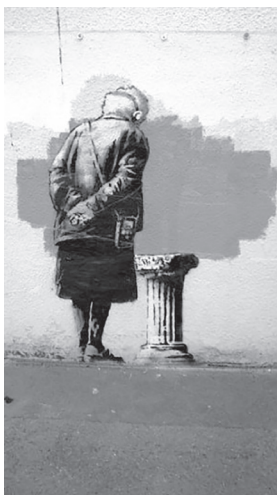
Banksy alkotása a „részlet” eltávolítása után 161

Ez az eset állt fenn a Creative Foundation v Dreamland ügyben 158 is, amelyben brit bíróság először hozott döntést olyan fal tulajdonjogát illetően, amelyre egy graffiti került. 159 A jogvitában az ingatlan tulajdonosa azt sérelmezte, hogy Banksy-nek az épületen lévő Art Buff című művéről az ingatlan bérlője eltávolított egy elemet, 160 feltehetően azért, mert a falfestmény ezen részlete sokak számára zavarba ejtő lehet.