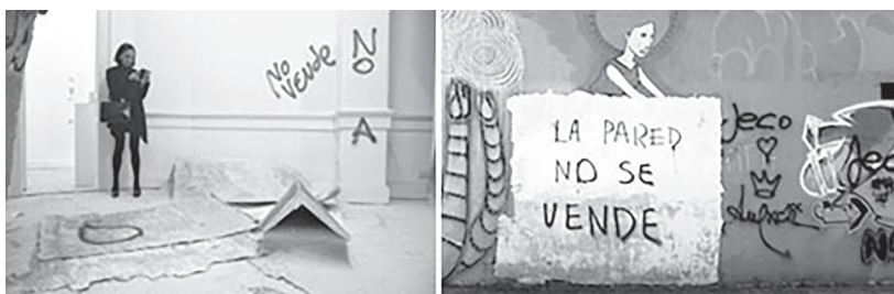
A művészek reakciója: „La pared no se vende” (A fal nem eladó!) 170

Habár voltak olyan művészek, akiknek tetszett a kiállítás koncepciója, a helyi graffiti közösségben nagy felháborodást keltett az akció, és a kiállítás nyitó estéjén egy csoport tönkretette a képeket. 168 Az incidens után a kiállítás további állomásait törölték. 169