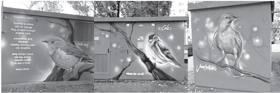
Védett madarak díszítik a szegedi trafóházat 132

A szellemi alkotásokat a művészek megbízás alapján is létrehozhatják. Ekkor a „megbízó”, azaz a későbbi felhasználó írásba foglalt felhasználási szerződést köt az alkotóval egy jövőben megalkotandó mű létrehozásáról, amelynek keretében a szerző díjfizetés ellenében engedélyezi művének felhasználását. 133 A felhasználási szerződés csak írásban köthető érvényesen, 134 amelynek elmaradása a szerződés érvénytelenségéhez vezet. 135