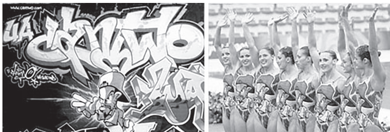
Cantwo alkotása eredeti környezetében és a kiemelt részlet a szinkronúszók dresszein 185

Néhány éve a spanyol szinkronúszó válogatott is kellemetlen helyzetbe került a Pekin-i Olimpián viselt úszódresszük miatt. Azt ugyanis a német származású graffiti művész, Cantwo egyik alkotása díszítette. Cantwo nyilvánosan tiltakozott művének jogosulatlan felhasználása miatt, de valószínűleg nem tett semmilyen jogi lépést az ügyben. 184