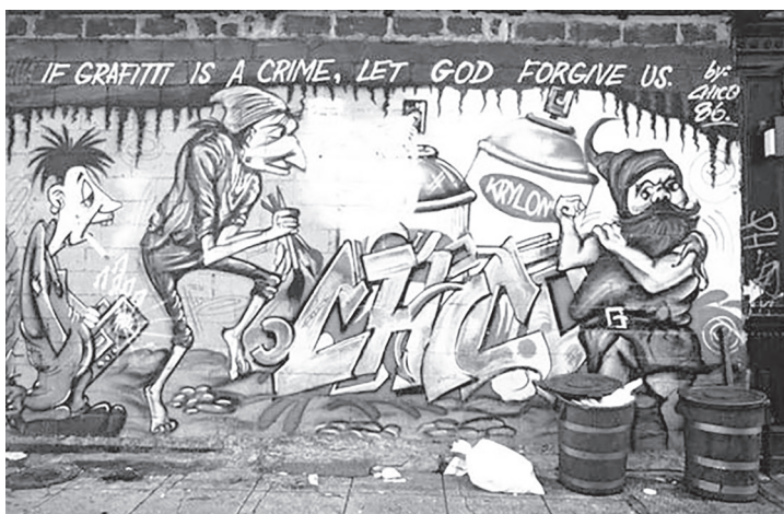
„If graffiti is a crime, let God forgive us. – by Chico 86” 67

A graffiti kriminalizációjának háttérében egyértelműen a tulajdon védelme, illetve közöség (közrend, köznyugalom) védelme áll. Az Egyesült Királyságban például az úgynevezett „broken windows theory-val” indokolják az illegális graffitizók büntetését. 64 Eszerint, ha egy törött ablakot nem javítanak meg, az azt az érzést kelti, hogy senki törődik ezzel, ezért egyre több törött ablak és bűntény lesz a környéken. 65 Ha ezt analógia útján a graffitik keletkezési körülményeire átültetjük, arra juthatunk, hogy ha egy az adott városrészben, kerületben a graffitizést eltűrik, akkor nem csak a graffitik fognak ott elszaporodni, hanem a súlyosabb bűncselekmények száma is meg fog nőni. 66