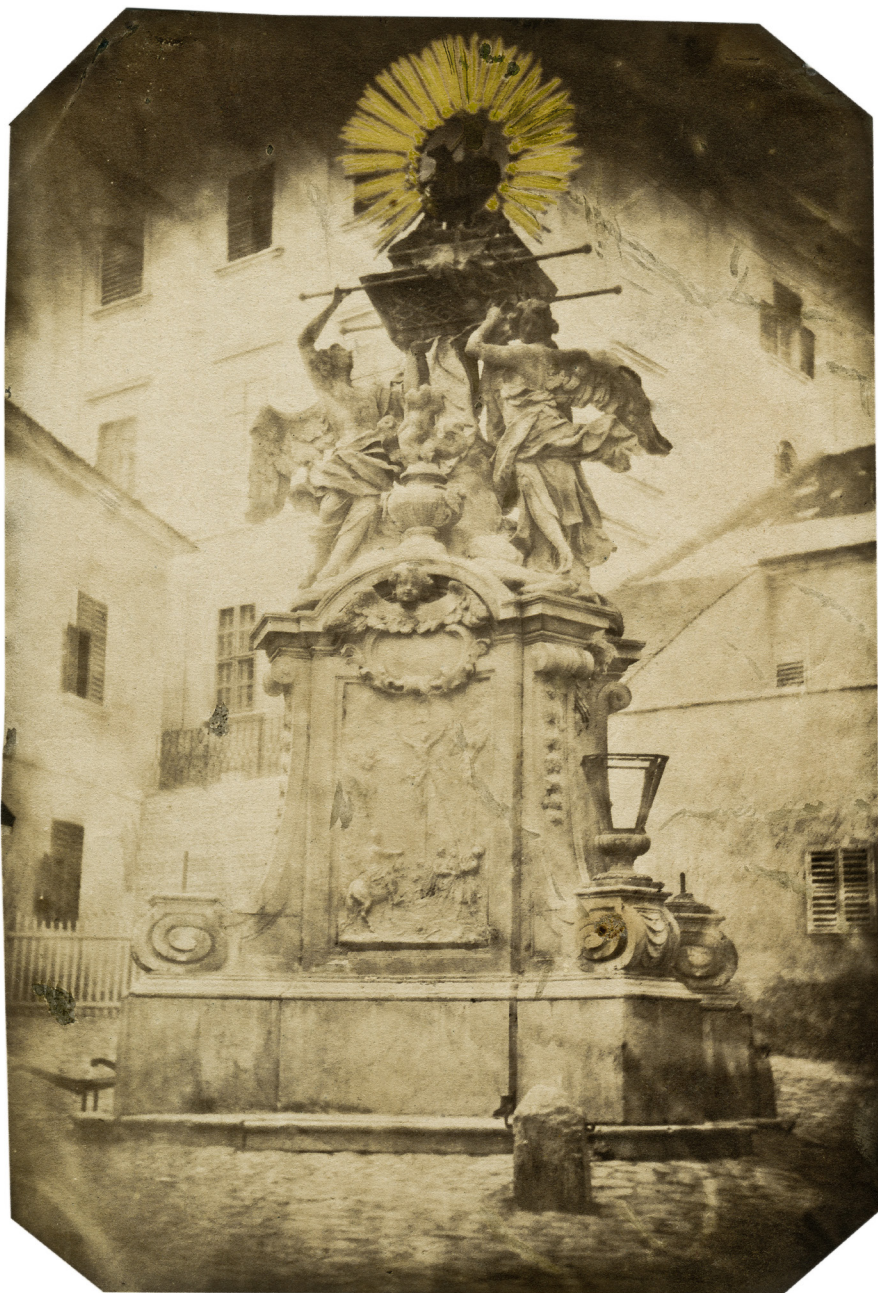
A Frigyláda szobor. Mayrhofer József fotográfiája, 1860 körül. Győri Egyházmegyei Kincstár és Könyvtár. Mayrhofer hagyatéék.