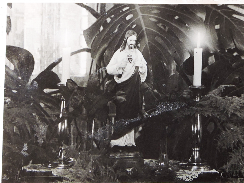
Jézus Szíve oltár a Török család otthonában