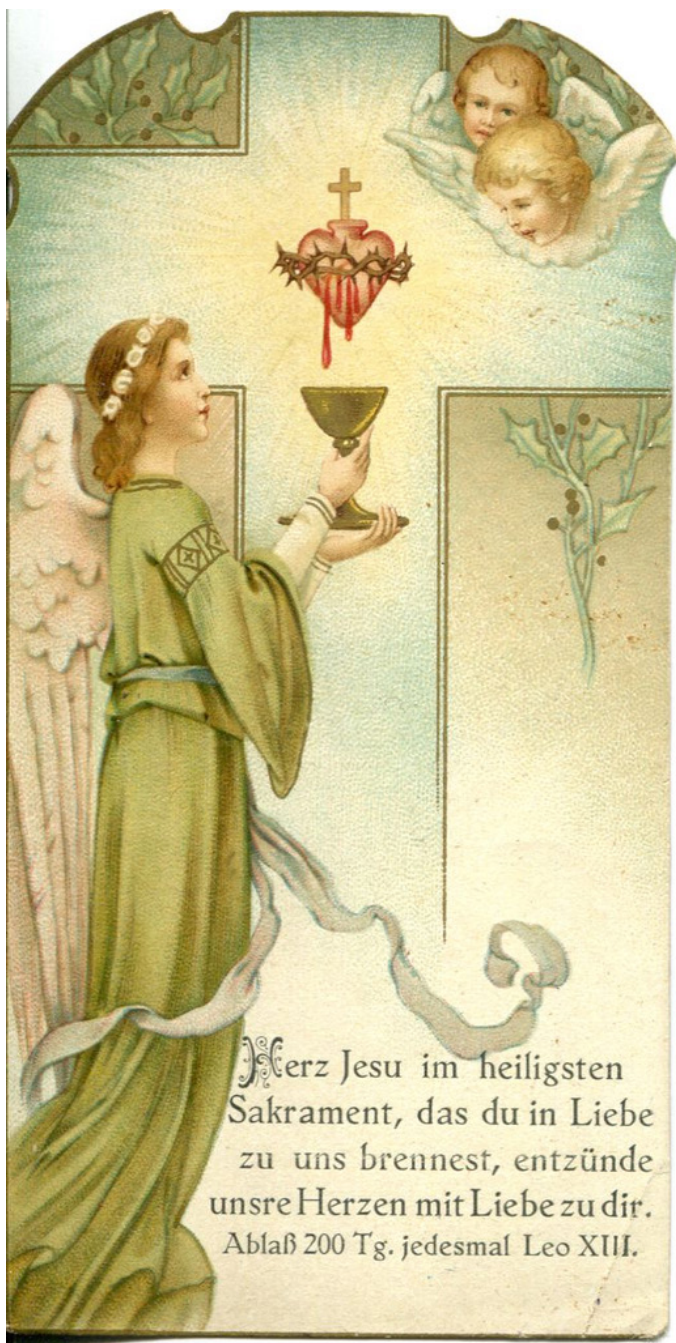
Német nyelvű szentkép (Forrás:Móra Ferenc Múzeum Bálint Sándor Hagyatéka Leltári szám: 77. B. 416–84/287.)