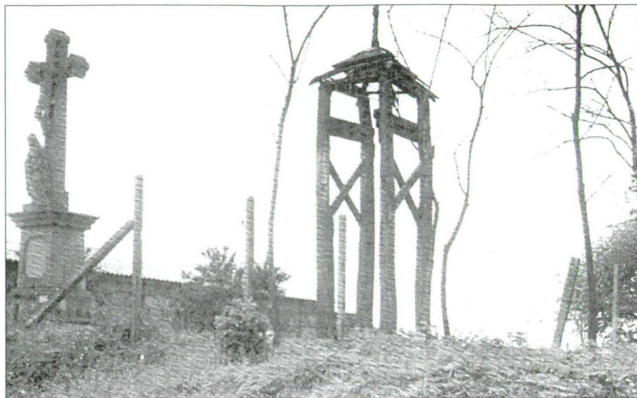
10. kép: A telekparti kereszt és harangláb