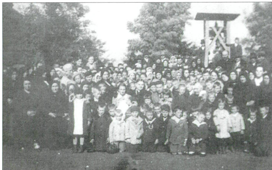
11. kép: Ugari ünnepség