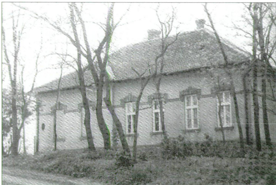
9. kép: A telekparti iskola