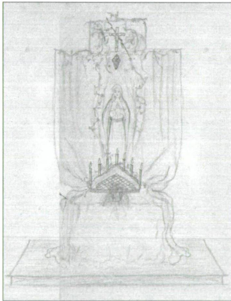
9. kép: Lourdes-i Mária oltár terve, dátum nélkül