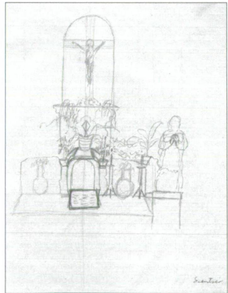
10. kép: Szentsír oltár terve, dátum nélkül