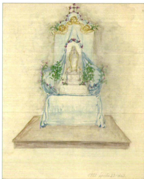
2. kép: Lourdes-i Mária (?) oltár 1922. április 23-án