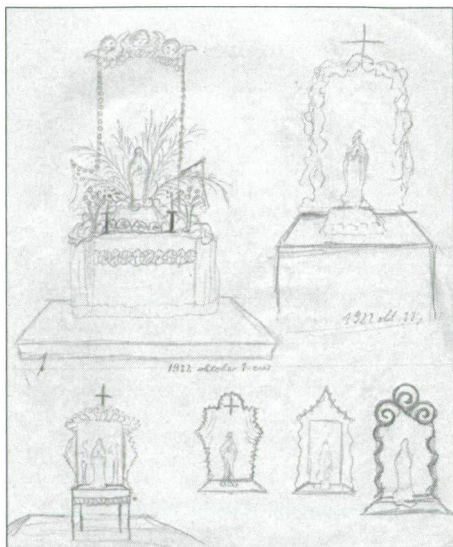
3. kép: Hatféle oltárterv, 1922. október 1. és 1922. október 22. talán terményáldási ünnepre