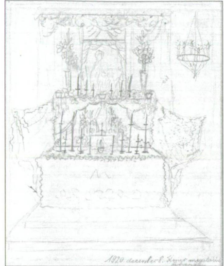
8. kép: Oltárterv 1920. december 8. A Mária Kongregáció megalakulásának ünnepén