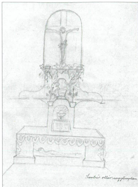
11. kép: Szentsír oltár terve, dátum nélkül, Kunszentmárton, nagytemplom