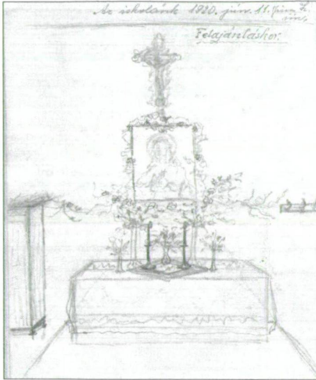
7. kép: „Iskolánk 1920. jún. 11. Jézus Szíve ün.” Az oltárterv mellett környezete: szekrény, fogas is feltüntetve