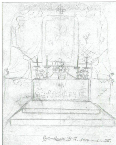
6. kép: Oltárterv Gyümölcsoltó Boldogasszony ünnepére, 1920. március 25.