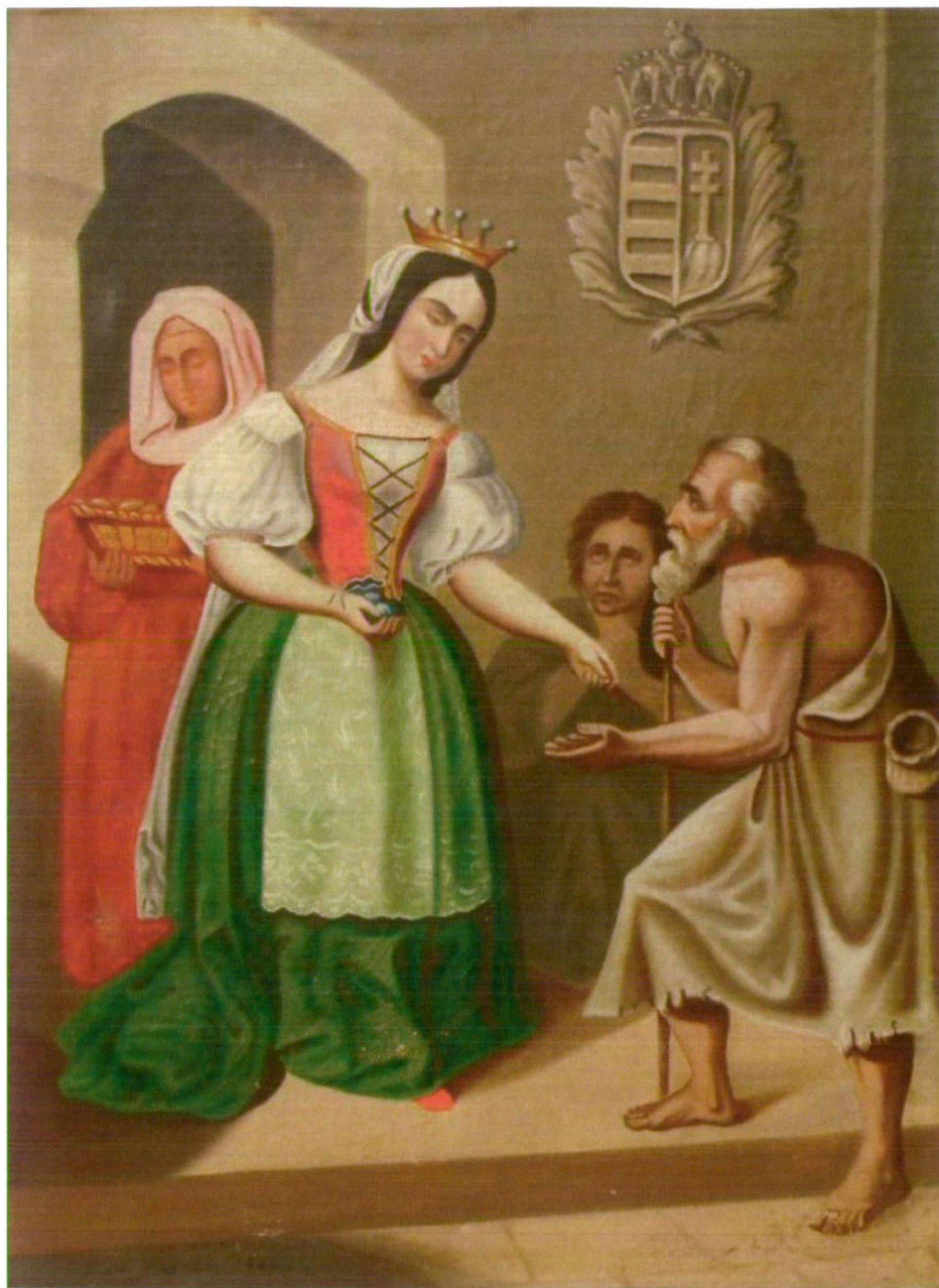
2. kép : A magyaros Szent Erzsébet képe Kunszentmárton, magántulajdon. Olaj, vászon. 94×52 cm, 1869. Baranyi pictor.