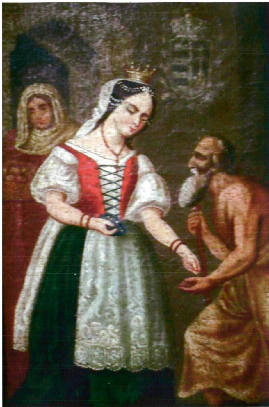
1. kép: A magyaros Szent Erzsébet Budapest, magántulajdon. Olaj, vászon. 83x44 cm, 1855 körül.