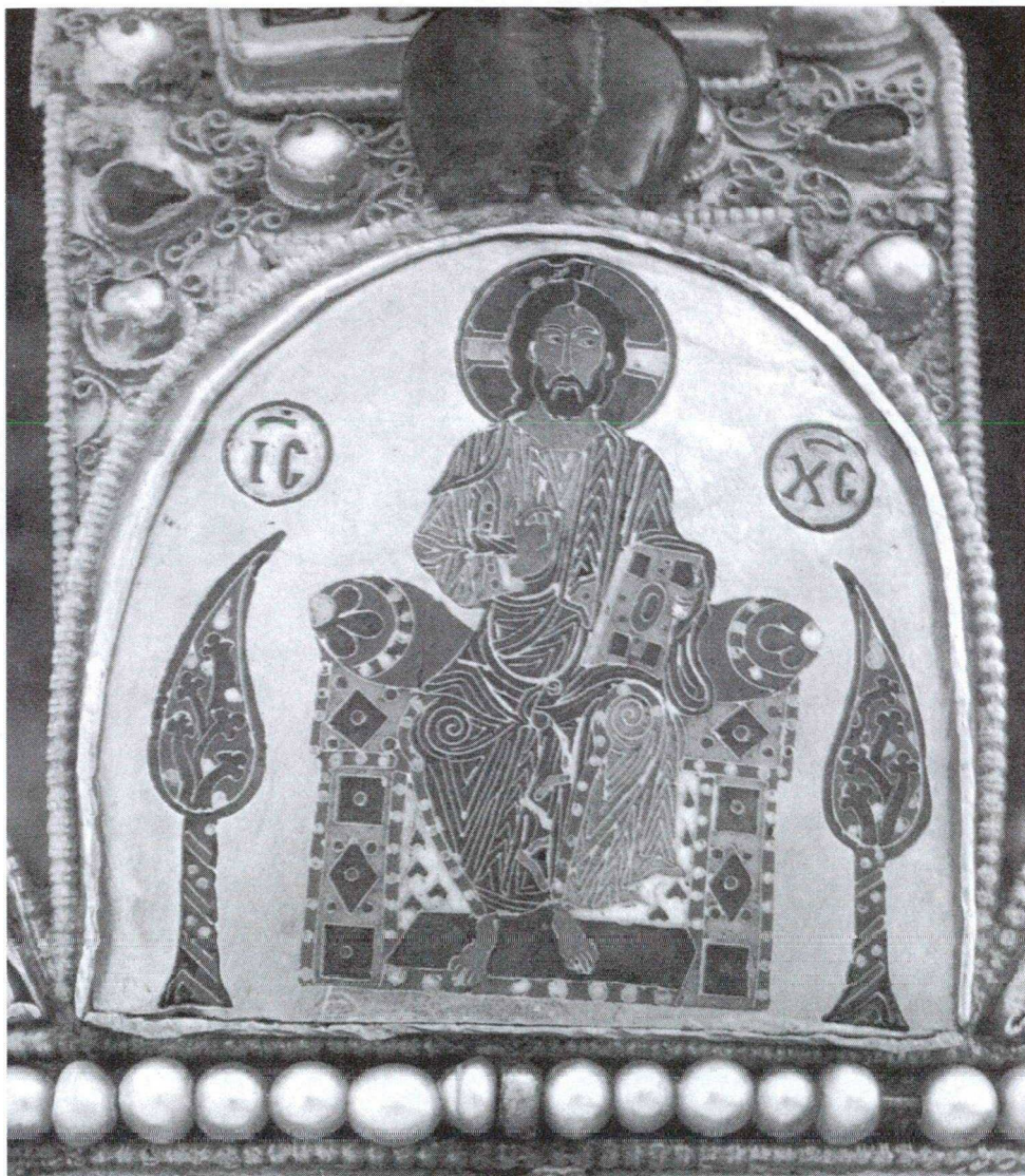
1. kép. Az ítéletet ülő Isten – és Emberfia. A magyar Szent Korona zománcképe.