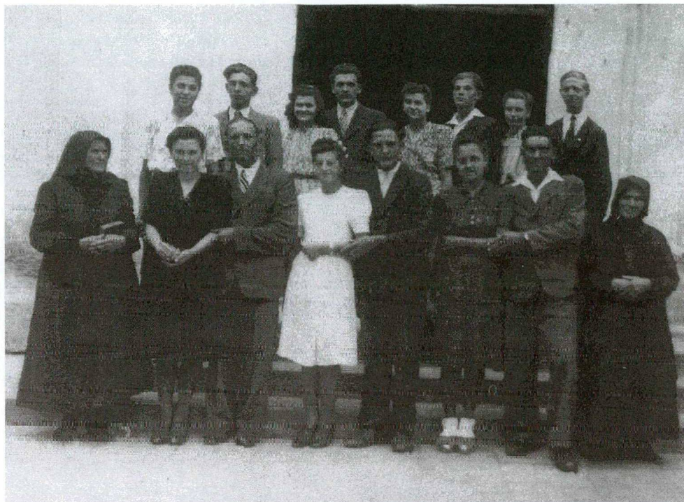
Rózsapár koszorúspárokkal és a két Mária-anyával, 1945. Földeák.