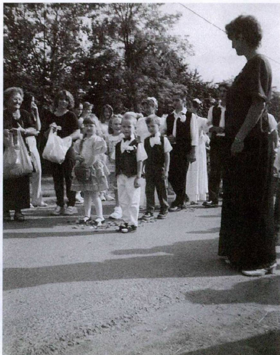
Ünnepi menet. Rózsaszirmot szóró koszorúspárok és az őket követő rózsapárok, 2001. Földeák.