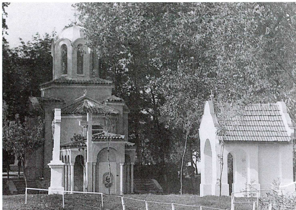
1. KÉP: A SÁNDORI KEGYHELY KÁPOLNÁI, A GÖRÖG KELETI ÉS A RÓMAI KATOLIKUS KÁPOLNA