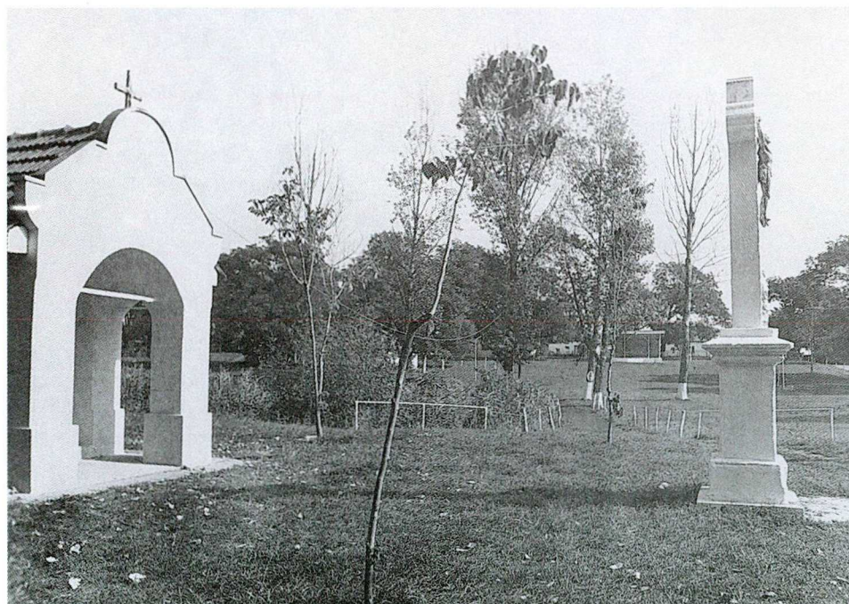
2. KÉP: SZAKRÁLIS ÉPÍTMÉNYEK A KATOLIKUS EGYHÁZ TERÜLETÉN