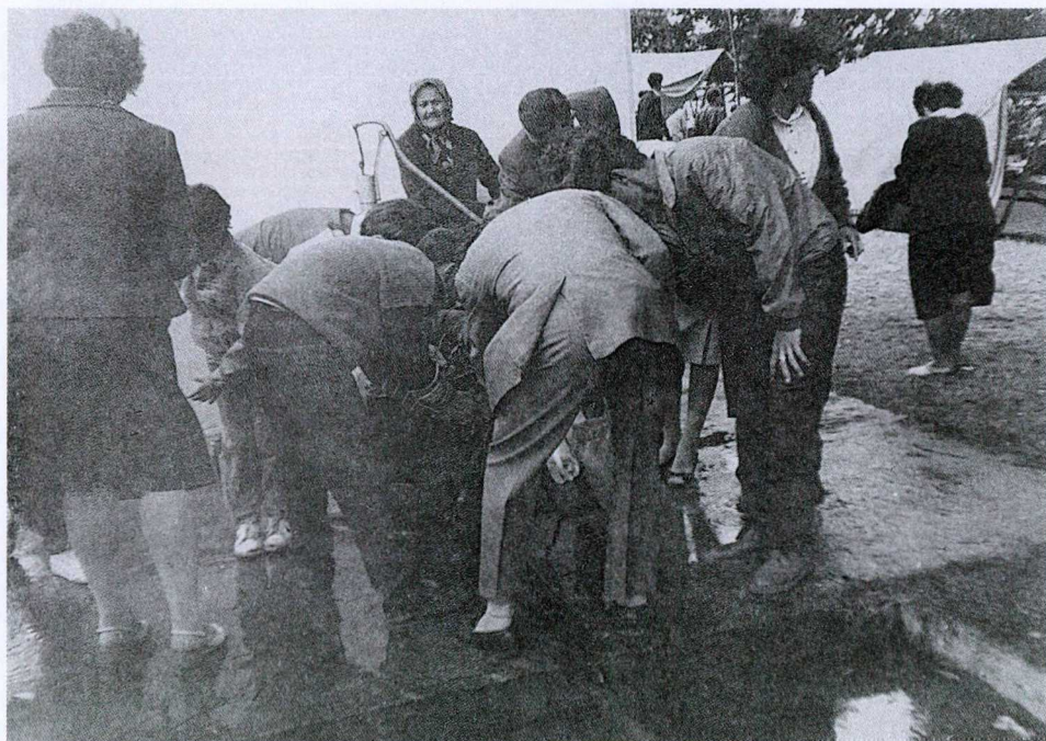
4. KÉP: KATOLIKUS ZARÁNDOKOK A KÚTNÁL