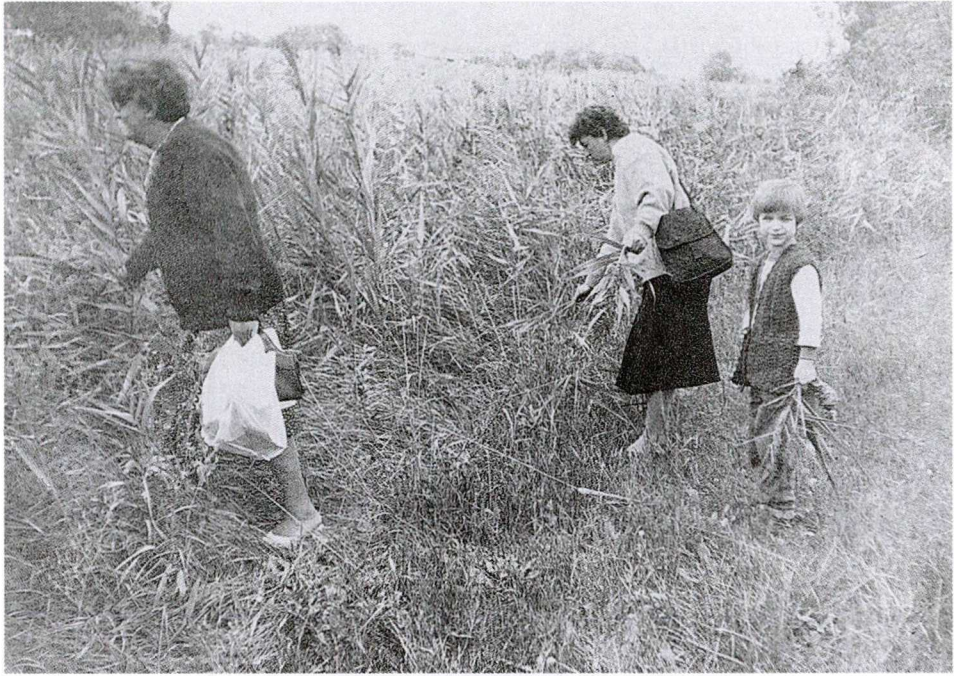
5. KÉP: NÖVÉNYEKET GYŰJTŐ ZARÁNDOKOK