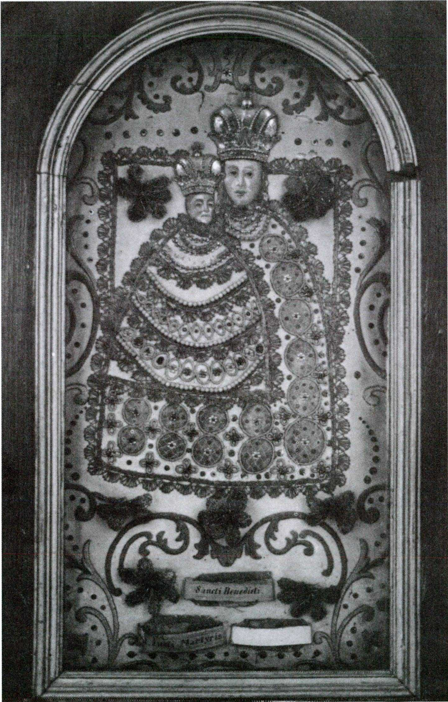
MÁRIACELLI KEGYKÉPMÁSOLAT A SZENT ANTAL OLTÁRON.