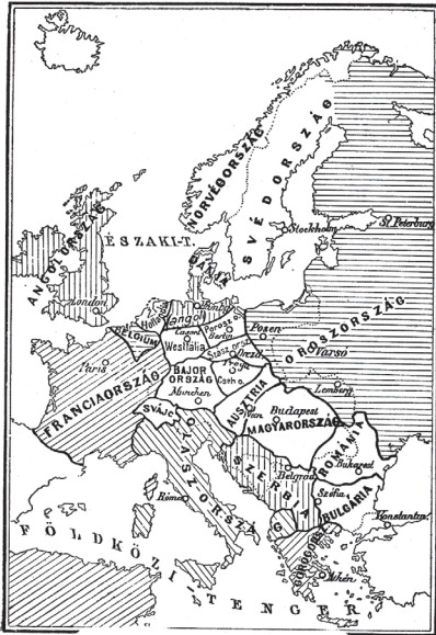
Európa térképe az antánt győzelme esetén.