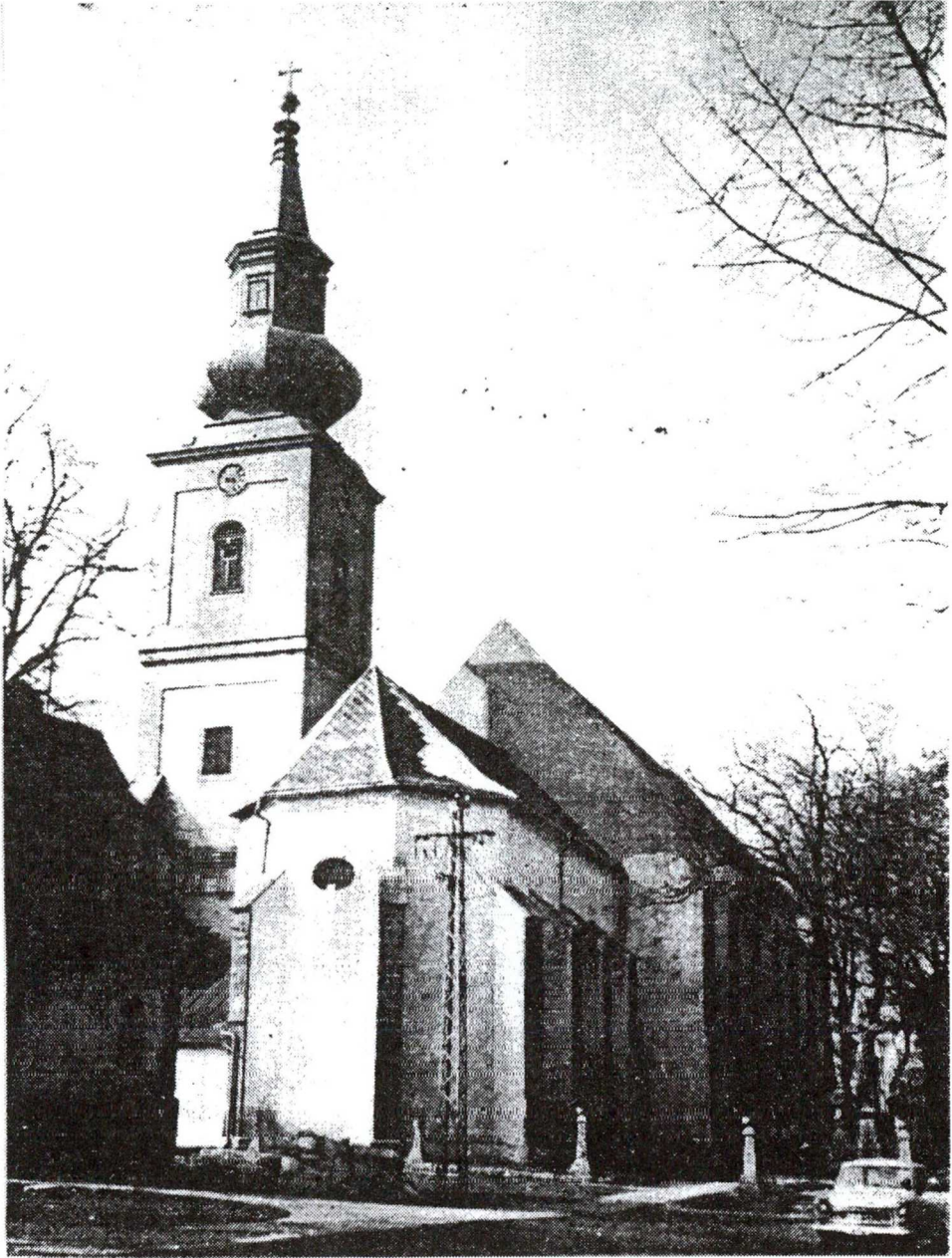
1. KÉP A JÁSZBERÉNYI FERENCES TEMPLOM