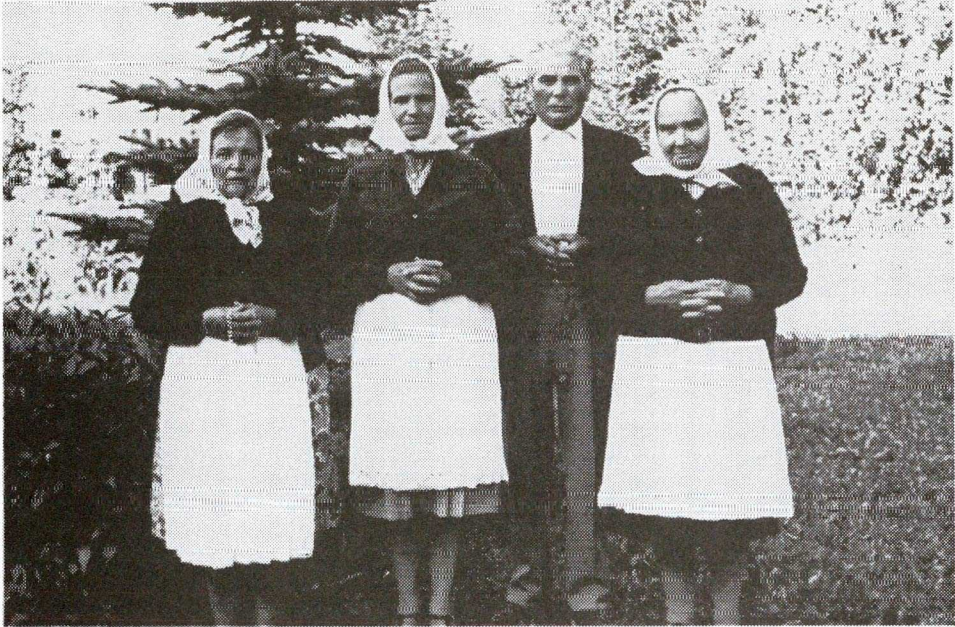
5. KÉP A BORZONTI TÁRSULATOK VEZETŐI