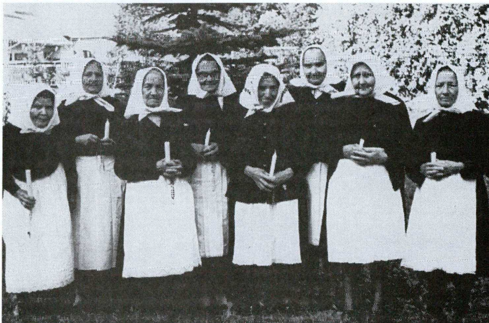
3. KÉP CSOPORTKÉP A TÁRSULAT LEGIDŐSEBB VEZETŐIRŐL. 1992