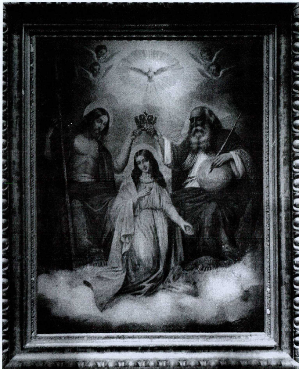
2. kép Szentháromságot ábrázoló festmény a felső kápolnában