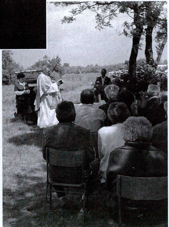
2. kép: A szentmise egy részlete (1998)