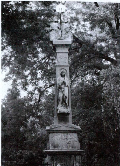
1. kép: Szentháromság oszlop, barokk