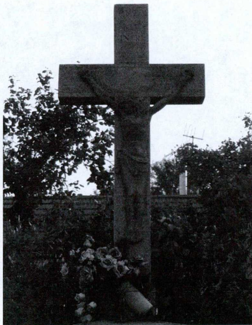
16. kép: Kereszt, Kossuth utca