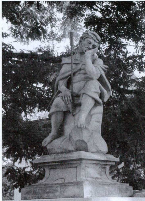
3. kép: Bánkódó kép, Bánkódó Krisztus, Fájdalmas Krisztus, 1775