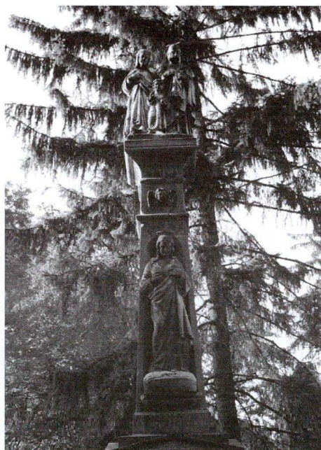
13. kép: Szent Család szobor 1899