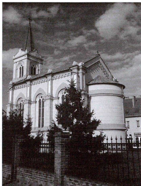
11. kép: Kalmár kápolna 1875-76