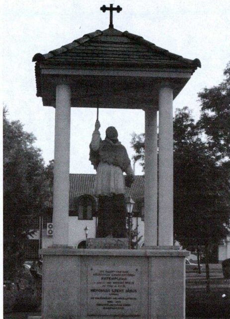
4. kép: Nepomuki Szent János szobor, 1799