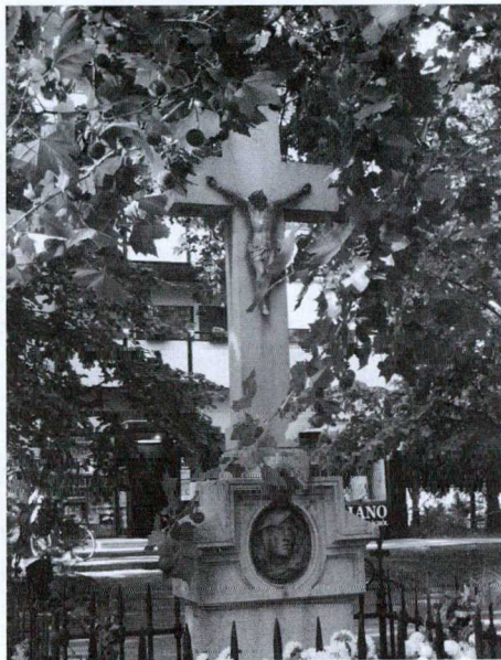
15. kép: Kereszt, Nefelejcs utca