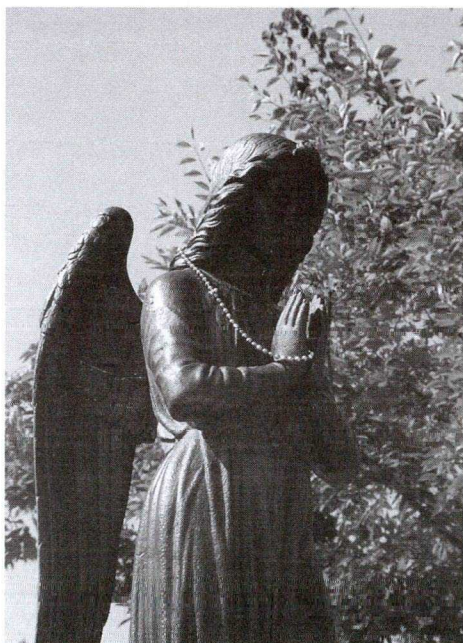
12. kép: Angyalos kút 1897