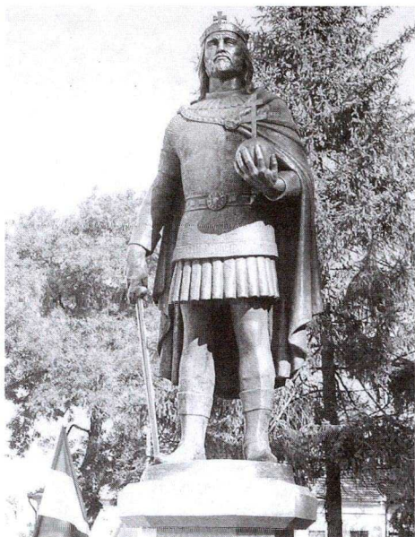
10. kép: Szent István szobor, 2005.