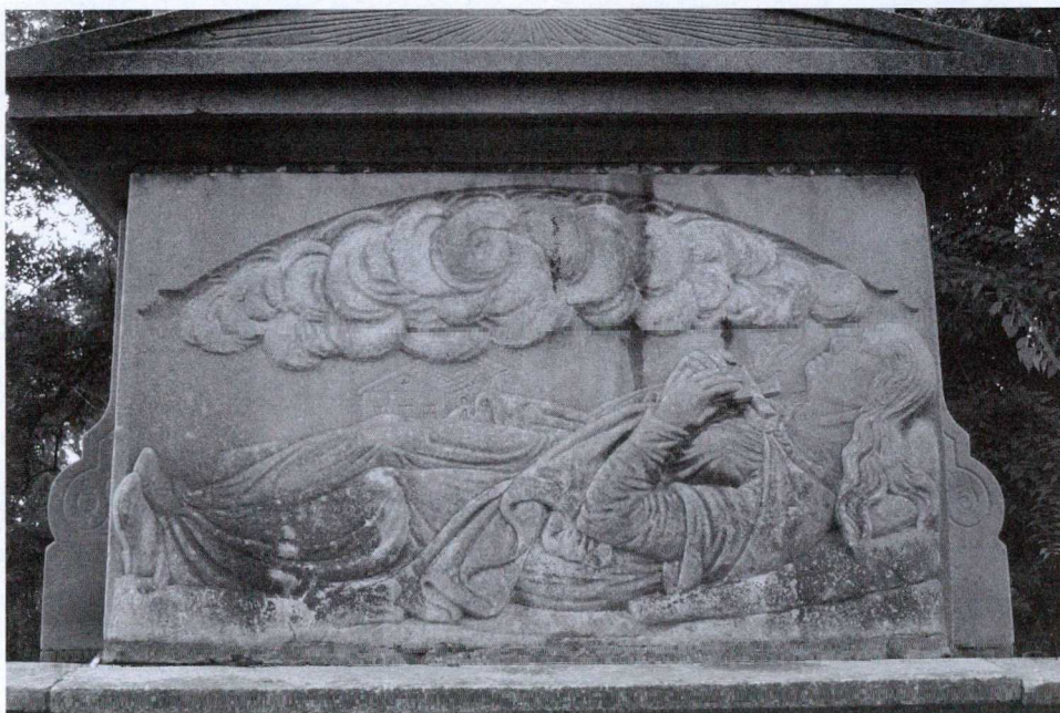
2. kép: Szentháromság szobor részlete, Sz. Borbála