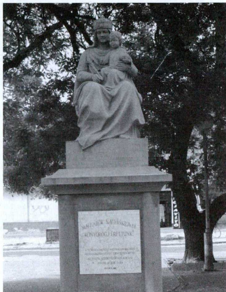
14. kép: Magyarok Nagyasszonya szobor 1929