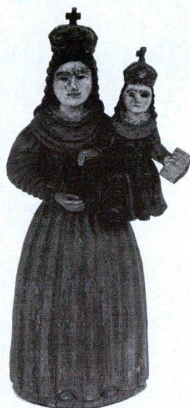
8. kép: Kiskun Madonna