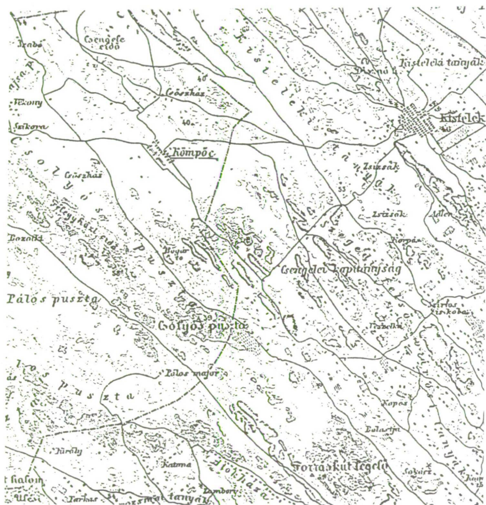
2. kép: Kömpöc a II. katonai felvétel térképén

A házassultak anyakönyveit vizsgálva pontos választ kapunk az egyes családok származási helyére vonatkozóan. 26