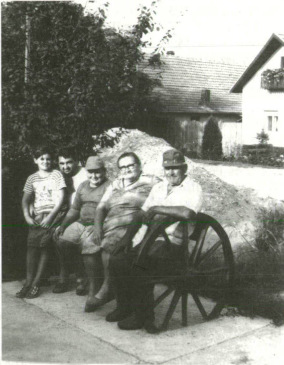
Rábéi család pihenőben.

Adatközlő a majdáni zadrugában traktorista, felesége háztartásbeli.