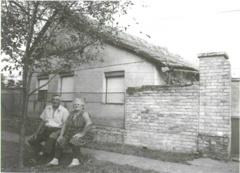
Rábén még szokás a ház előtti kispadon üldögélni