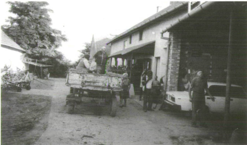
5. kép. A napszámósok indulnak kukoricát kapálni