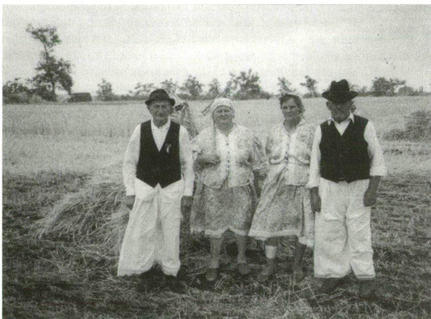
2. kép. Szajáni aratópárok hagyományos öltözetben (Felsőhegy, 2000.)