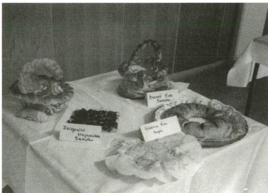
4. kép. Péksütemény-kiállítás (Szaján, 2000.)