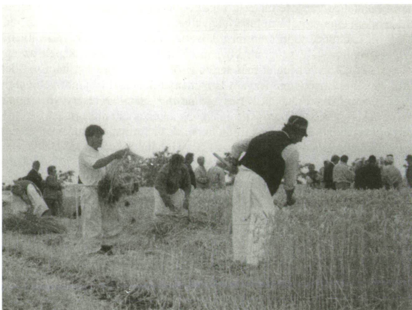
1. kép. Szajániak az aratóversenyen (Felsőhegy, 2000.)