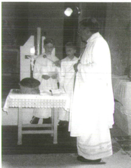
5. kép. Kenyérszentelés (Szaján, 2000.)