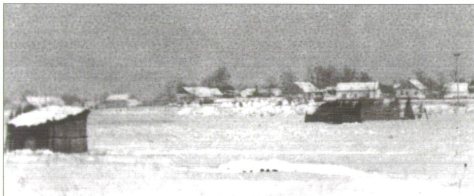
3. kép Karám és juhászkunyhó a falu szélén

A juhászok a juhok legelőn történő nyári éjszakázására mozgatható, fedetlen karám okat építenek. 34 A karámot lécekből összeszegelt, 80 cm magas, három és fél méter széles kollátok ból állítják össze, négyzetes vagy kör alakúra. Ide hajtják be fejéskor a birkákat és ebben is éjszakázik a nyáj.