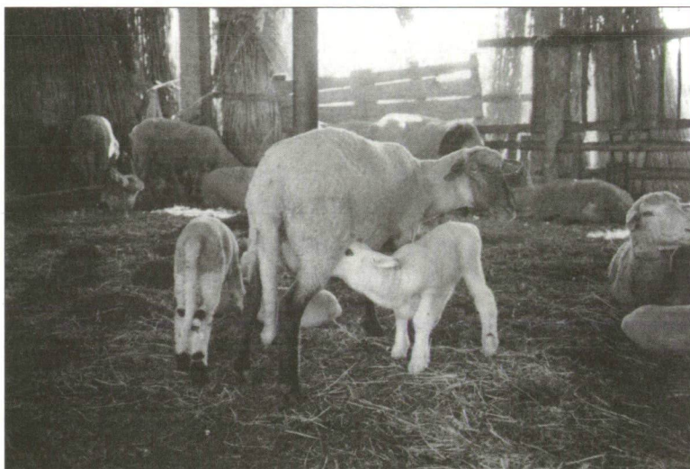
5. kép Birkasupa