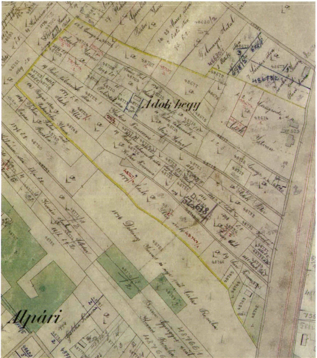
1.kép Az Ádokhegy Jakabffy Lajos Szeged határát ábrázoló, 1919-ben kiadott térképén