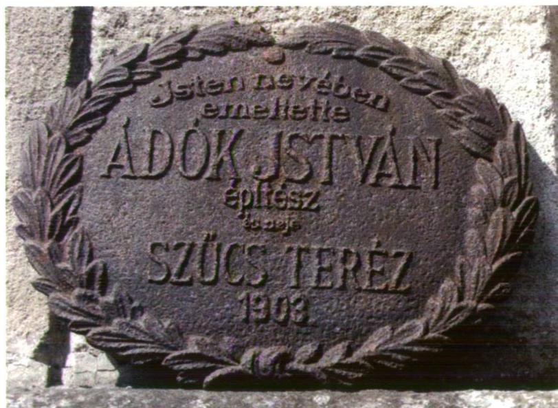
3. kép Az Ádok-kereszt feliratos táblája (2010.)