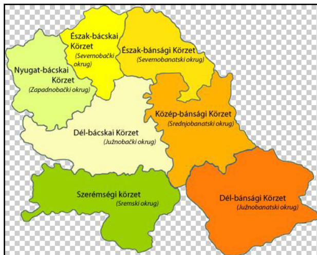
4.ábra A Vajdaságot alkotó hét körzet

Az egyes körzetek mezőgazdasági adottságait, illetve a mezőgazdasági termelés terén a Vajdaságban betöltött szerepét torzítja, hogy területük nagysága különböző. Erre a legjobb példa Észak-Bácska, amely a mezőgazdasági területeket tekintve a legkisebb szeletet foglalja el, de a körzet összes területéhez viszonyítva itt a legmagasabb a művelés alá vont területek aránya (88,9%).