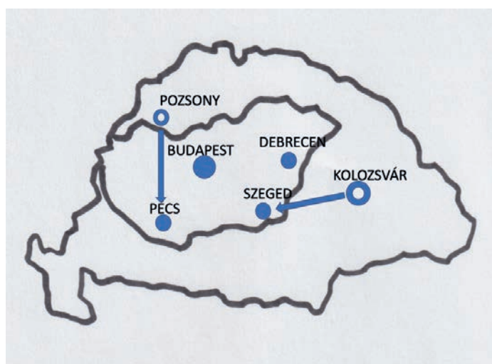
2. ábra. Magyarországi egyetemi központok Trianon után.

A megrázkódtatások gazdasági és társadalmi hatása tartós volt, ezzel együtt az 1920-as évtized konszolidációt hozott. Magyarországot az 1920-as évek elején még sokan életképtelen államnak minősítették, az évtized során azonban sikerült talpon maradni és megerősödni. Ebben kiemelt szerep jutott gróf Klebelsberg Kunó miniszternek, aki először a belügyi, majd a vallás- és közoktatásügyi (másként kultuszminiszteri) tárcát vezette Bethlen kormányaiban. 1922 és 1931 között. Klebelsbergnek sikerült a határon túlra került felsőoktatási intézmények egy részét rövid idő alatt újjászervezni. További segítségével megindulhatott a vidéki egyetemek helyzetének megszilárdulása, majd megerősödése.