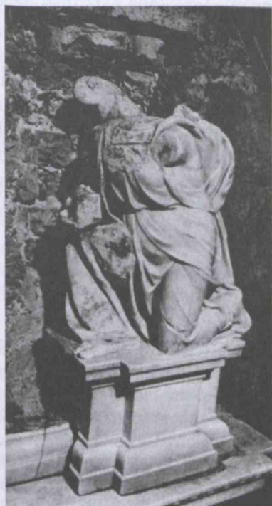
3. kép Térdelő angyal, részlet az oltárról