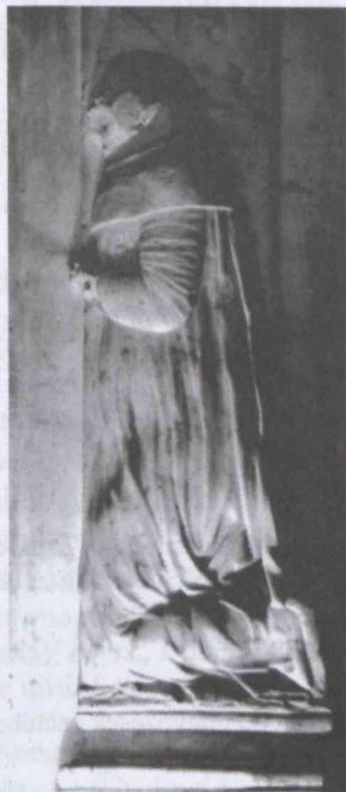
4. kép Bakócz Tamás térdelő alakja az oltárról