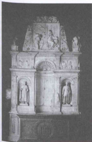
1. kép Az esztergomi Bakócz-kápolna oltára, Andrea Ferrucci, 1517.