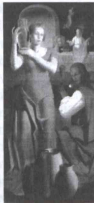
11. kép Kontuly Béla: Kánai menyegző (Bálint Sándor hagyaték, Móra Ferenc Múzeum, Szeged)

Kontuly falképfestészetének kiemelkedő alkotásait itt nem részletezzük. Monumentális vállalkozásainak leghíresebbje a sümegi Sárlos Boldogasszony ferences kegytemplom főhajójának (1953-1955) és szentélyének mennyezetfreskói. Utóbbi 1968-ban, 64 évesen fejezte be. Ez után nem vállalt több megterhelő falfestészeti munkát.