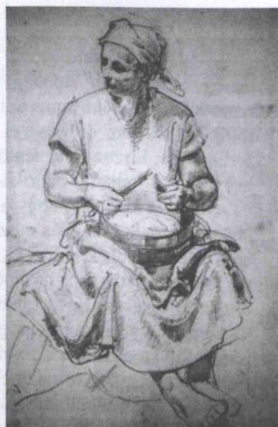
4-5. kép Tanulmányrajzok a paprikás festményhez (Az örökös tulajdonában)