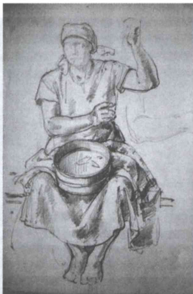
2-3. kép Tanulmányrajzok a paprikás festményhez (Az örökös tulajdonában)