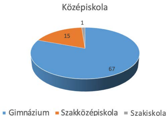
2. ábra – A válaszadók középiskolájának jellege (N=83)

A megadott középiskolai intézmények közül 45 (54,2%) helyezkedik el városban, 34 (41%) megyeszékhelyen, 3 (3,6%) faluban és 1 (1,2%) a fővárosban, Budapesten.