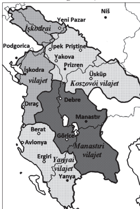
Map 1. The Albanian vilajets (Turkish names and present borders in background)