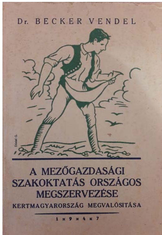
3. kép: A mezőgazdasági szakoktatás országos megszervezése. Kertmagyarország megvalósítása című könyv borítója

Beckert haláláig foglalkoztatta a téma, még 1947-ben, egészen megváltozott körülmények között is új javaslatokkal állt elő: A mezőgazdasági szakoktatás országos megszervezése. Kertmagyarország megvalósítása című összefoglaló munkájában – megint csak rendkívüli részletességgel kidolgozott nevelőképző főiskolai tervében – már az új típusú általános iskolai alapokon megszervezett, szövetkezeti elemeket, szociális gondolatot hangsúlyozó megfontolásokat vonultat fel, amellet, hogy az évtizedek alatt kimunkált, jól bevált gyakorlatot is igyekszik átmenteni az új keretek közé.