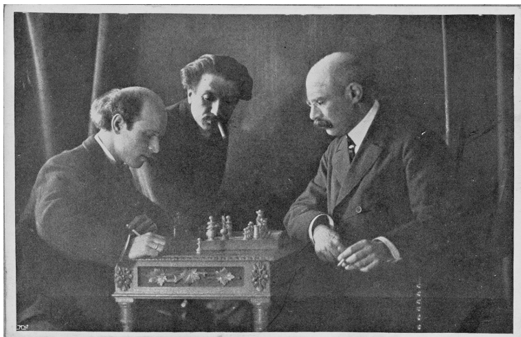
Pablo Casals, Jacques Thibault és Emanuel Moór

Az, hogy műveit egyre többen játsszák, újabb művek írására ösztönözte őt: így született a Pablo Casalsnak ajánlott 2. csellóverseny, majd a két gordonkára írt versenymű, amellyel Casals és Guilhermina Suggia nagy sikert aratott Moszkvában is.