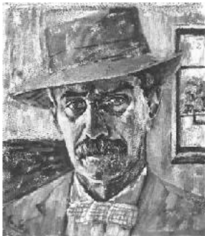
Moór Emánuel: Önarckép