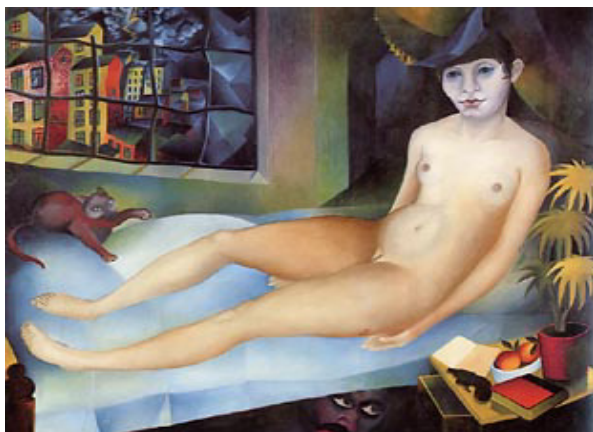
5. kép Heinrich Maria Davringhausen: A kéjgyilkos (1917)

Davringhausen 1917-es, A kéjgyilkos c. képe csak látszólag mutat fordított szereposztást, bár ezen a képen a női alak látható a kép előterében, és a férfi figura rejtőzik el a háttérben. Az Olympia pózában ágyon fekvő, meztelen nő felszabadult, magabiztos benyomást kelt, mint aki modern nőként saját életének és sorsának ura. Valójában azonban kiszolgáltatott, fenyegetett személy, aki számára a szabadság nem több mint illúzió, és aki nem több mint egy gátlásoktól mentes, csak a saját érdekeit néző, a másik embert pusztán objektumként kezelő gyilkos még mit sem sejtő áldozata.