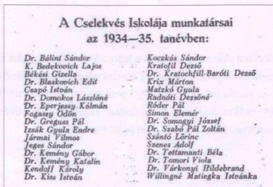
2. kép: A Cselekvés Iskolája munkatársai az 1934-35. tanévben