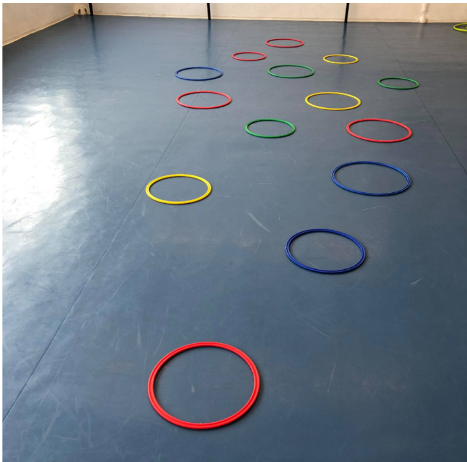
2. ábra: A játék területe

Menj végig úgy, hogy összesen 7 karikát használhatsz! Se többet, se kevesebbet!