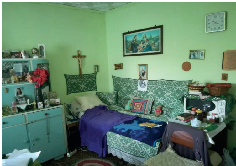
1. kép: Az élettér leszűkülésének következtében az ágy köré koncentrálnak a szakrális és a profán használati tárgyak is. (Csíkszentdomokos, Hargita megye)

zentációs terek kompozíciói, hiszen ezeket ritkán változtatják. Az utóbbihoz pedig a használat során kialakuló minden esetleges tárgye gyűttes, amely bármilyen formát felvehet. Csíkszentdomokoson láttam élelmiszerek, gyógyszerek, kozmetikumok közé vegyülni kisebb szentképeket és tárgyakat. Ez különösen igaz idősek esetén, mivel a kor előrehaladtával egyre jobban leszűkül az élettérük.