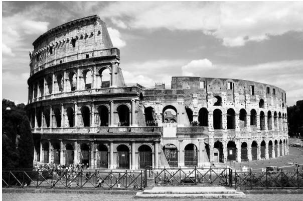
1. ábra: Colosseum mai látképe

bőkezűsége, mint a látványosságokra ” – írta Marcus Aurelius császár nevelője, Marcus Cornelius Fronto (ford. Borzsák István, Grüll 2000: 14.).