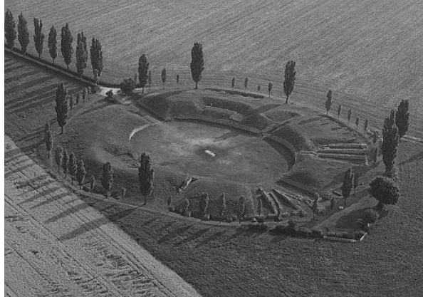
4. ábra: Carnuntum polgárvárosi amphitheatrum