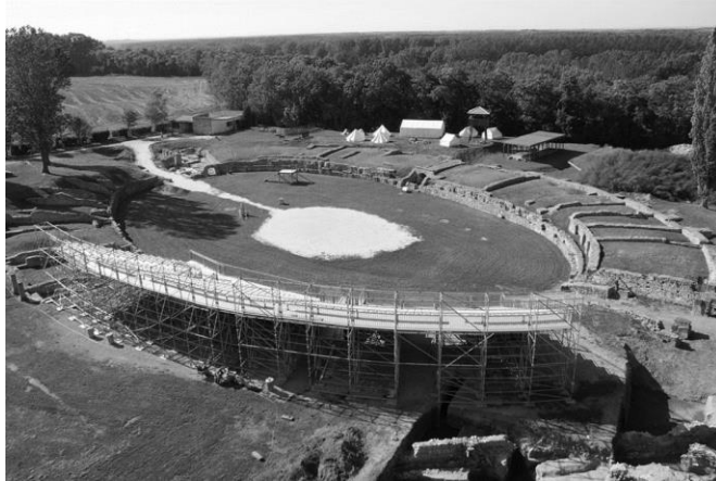
6. ábra: Carnuntumi legionárius amphitheatrum