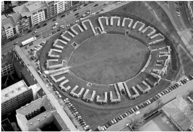
5. ábra: Aquincumi legionárius amphitheatrum

Az összehasonlításból kitűnik, hogy a katonai amphitheatrumok esetében fordított felállásról beszélhetünk, ugyanis ebben az esetben kétszer nagyobb az aquincumi aréna, mint a carnuntumi testvére. Szükséges kihangsúlyozni, hogy általában minden legiotáborhoz tartozott amphitheatrum, viszont elsődleges funkciójuk nem a tömegszórakoztatás volt, hanem a katonák felkészítése és kiképzése. Másodsorban színhelyül szolgálhatott katonai parádék számára, elítéltek kivégzésére és más hétköznapi események megrendezésére.