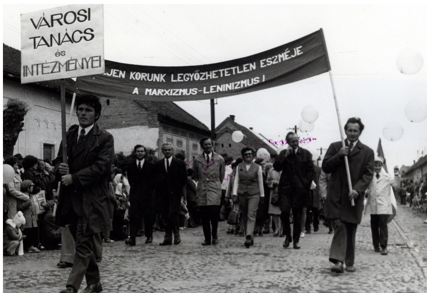
Május 1. Felvonulás

Többek között Mocsár Gábor cikkének hatása és valóságtartalma, valamint a helyi városi tanácsnak az a terve, hogy az „egyházi kezelésű temetők temetkezési területét városrendezési szempontból csökkenteni kívánja” azon túl, hogy felháborodást keltett, megérlelte a változás igényét. 42 A temető védelmében Erdei Ferenc – aki a Tiszántúli Református Egyházkerület főgondnoka is volt – felemelte a szavát, több levelet is megfogalmazott és megállapította,