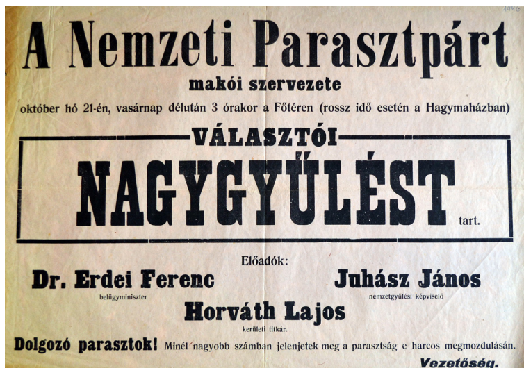
A Nemzeti Parasztpárt plakátja

Ebben a folyamatban fontos lépés volt az iskolák államosítása, amelyre a köznevelés szocialista átalakítása miatt volt szükség. Ebben meghatározó szerepet látott el – felsőbb utasításoknak megfelelően – a Pedagógusok Szakszervezete. Az egyházi iskolák átvételét államosítási biztosok irányították. 10 Ezzel viszont nem mindenki értett egyet. Mindszenty bíboros a Marosmenti Mária-napok keretében 1948. május 22–23-án látogatott Makóra. A résztvevők nevében 23-án