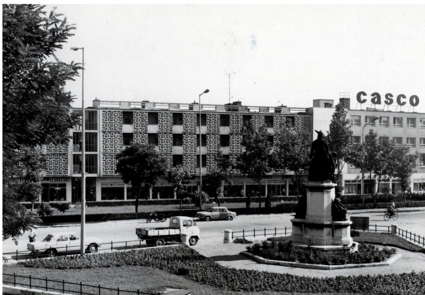
A város főtere a Rátki György tervezte Csipkeházakkal