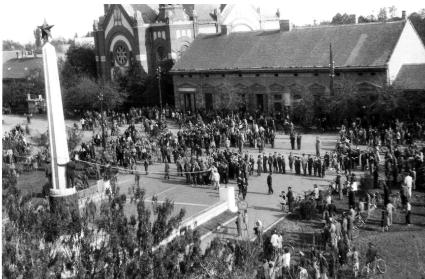
1956. október 26. A Szovjet Hősi Emlékmű ledöntése

A Nagy Imréhez köthető „olvadás” eredménye volt, hogy rövid ideig megjelenhetett a Fényszóró című kulturális lap a művelődési ház szerkesztésében olyan számmal is, amellyel a helyi József Attila kutatás első helyi eredményeiről adott hírt. 32 Az enyhülés csak 1955 tavaszáig tartott. A Nagy Imre kormány eredményeinek felszámolása, és Gerő Ernő keményvonalas politikája tovább növelte az elégedetlenséget.