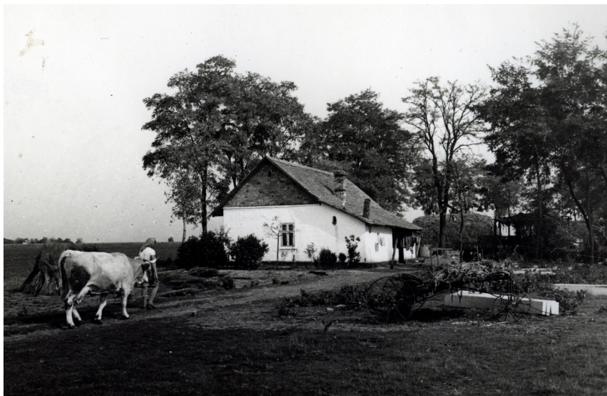
Életkép a tanyavilágból

A gazdaság szocialista átalakítása folyamatában a magántulajdonból állami lett. A gazdaságot a tervgazdálkodás követelményei szerint irányították, és főleg a Szovjetunió és USA közötti lehetséges háborúra készítették fel. Makón jelentős ipar nem volt. Az államosítás a kisiparosoknak a szövetkezetekbe kényszerítést jelentette. 1949 januárjában megalakult Makói Sütőipari és a Makói Cipő- és Csizmadia Szövetkezet. Az év végére befejeződött a tíz főnél több munkást foglalkoztató kisüzemek államosítása, és 1950-ben sorra alakultak a különféle szövetkezetek így például a Fodrász és Kosmetikai Kisipari Szövetkezet, a Vas- és Fémipari Termelőszövetkezet, a Mezőgazdasági Felszereléseket Gyártó Kisipari Termelőszövetkezet, az Építőipari és Kisipari Termelő Szövetkezet, az Asztalos Kárpitos és Fényező Kisipari Szövetkezet, a Házipari Szövetkezet stb. 13